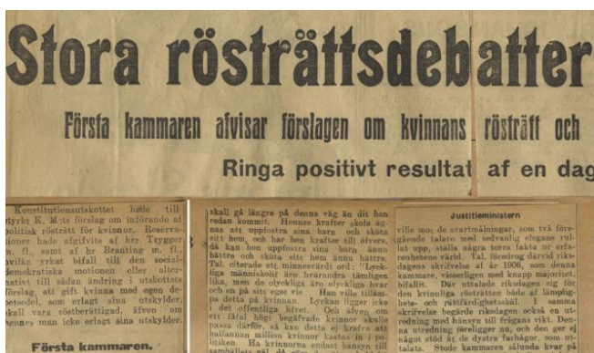
Stora rösträttsdebatter i riksdagen, 1912. Referat av debatten, Stockholms dagblad, 19 maj 1912.