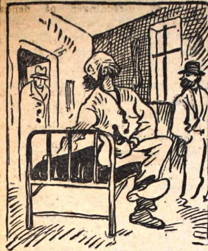
Misstänksamhet i blickar och åtbörder.

anspråk. Ett rum med 10 sängar hade dimensionerna 6,42 1/2 i ung. mått. Det blir c:a 6 kbm. per individ. Sign. hörde här och där smållandet av korkar, förnam fläktar av dunderstank och uppfattade ord som: "Ska' du ha dig en dragnagel." "Ska du ha dig en dj—l." etc.