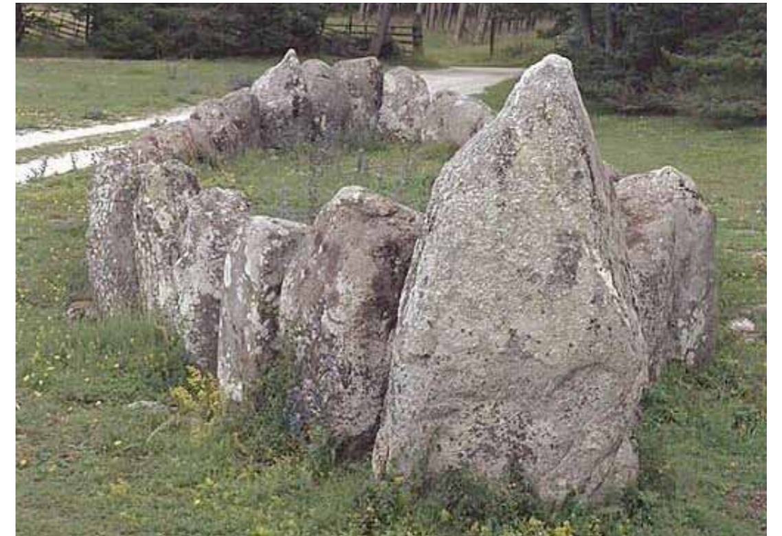
Så här kan en skeppssättning se ut. Denna finns i Grisvård på Gotland.

De medeltida gårdsägarna där hette under ett par århundraden Björn, Björnsson och Björnsdotter. Runt Lillsjön fanns under yngre järnålder - förutom Ulvsunda - även gårdarna Linta, Riksby och Nora. Sjön var då betydligt större och kunde nås från Mälaren via en bred och seglingsbar vattenled.