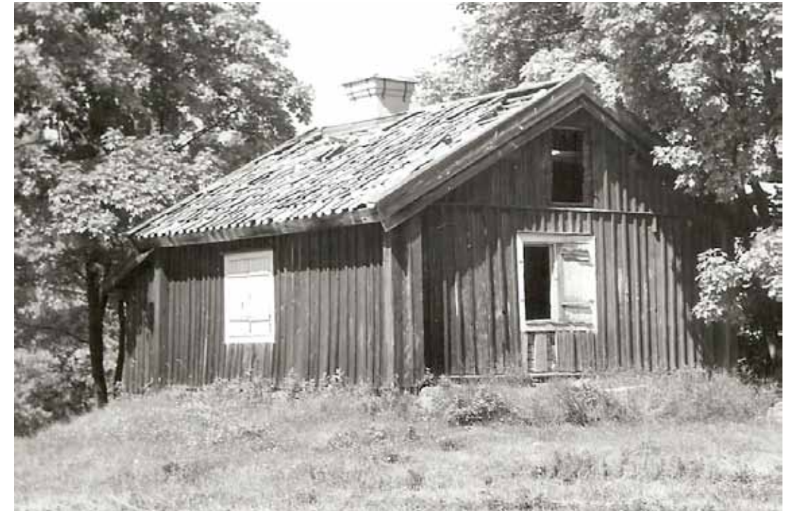
Det nu rivna Björklundstorpet (Båtsmanstorp på kartan). Foto från 1950-talet.

innehåller sten eller högar som främst innehåller jord och oftast är något högre. En av gravarna, nr 8, undersöktes 1939. I graven fanns ett brandlager, skärvor från ett lerkärl och några järnspikar.