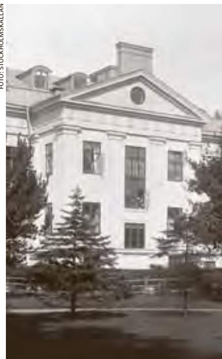
Södra Barnbördshuset kring sekelskiftet 1900.