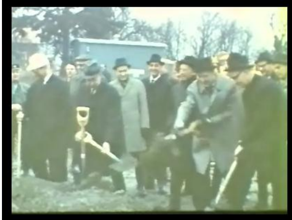
Första spadtagen tas till det moderna Akalla.