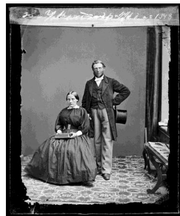
Ett gift par, 1864-77.