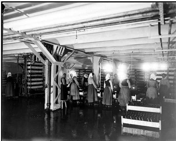
Bryggeriarbeterskor, 1901.