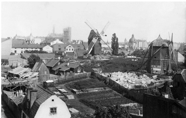
Tegnérslunden, 1870-90.

Fråga din lärare hur du ska redovisa arbetet!