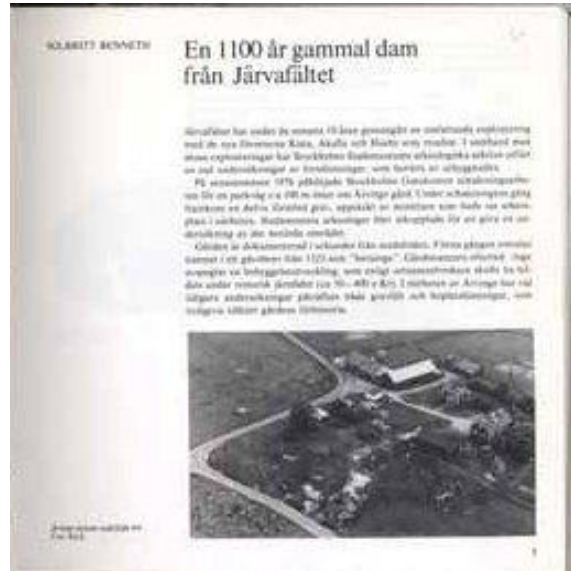
Artikel av Solbritt Benneth, 1978.

År 1976 hittades en grav i närheten av Ärvinge gård där en kvinna låg begravd. Hon hade varit ovanligt lång för sin tid, cirka 170 cm, och blivit ovanligt gammal, 50-65 år. Olika saker hade lagts ner i graven; bland annat en sjal runt axlarna, en kruka med mat och smycken. Kvinnan hade levt på 800-talet efter Kristus, det vi idag populärt kallar vikingatiden. Men vad kan man egentligen lära sig om livet för 1100 år sedan genom att studera en gammal grav?