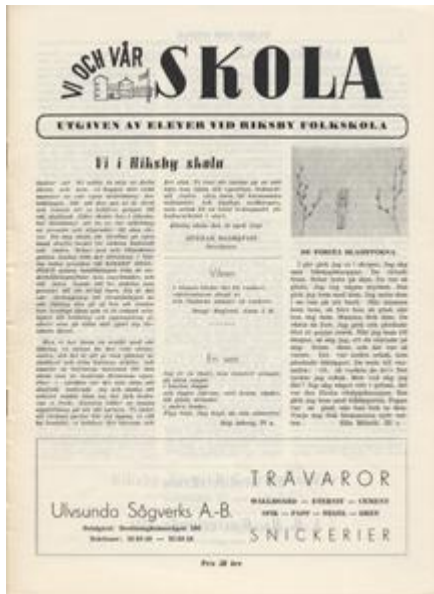
Tidningen Vi och vår skola , 1946.