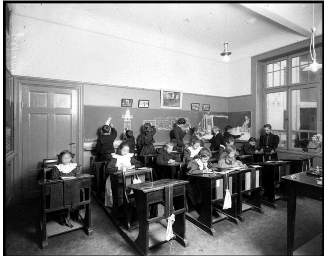
Interiör från folkskola, 1912.