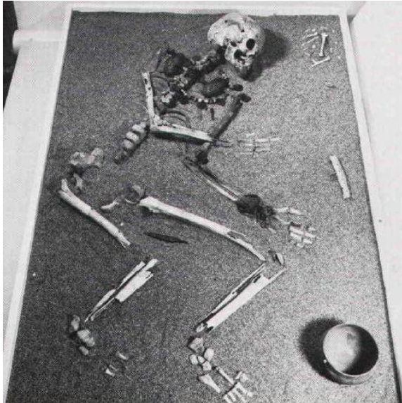
Rekonstruktion av 800-talsgrav.