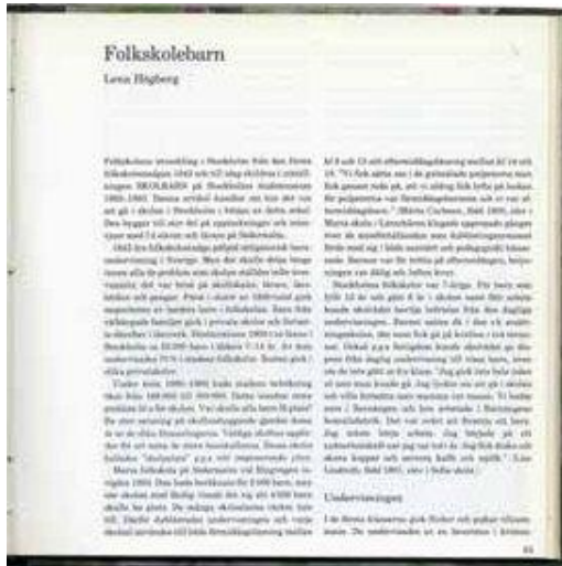
Artikel om folkskolan av Lena Högberg, 1983.