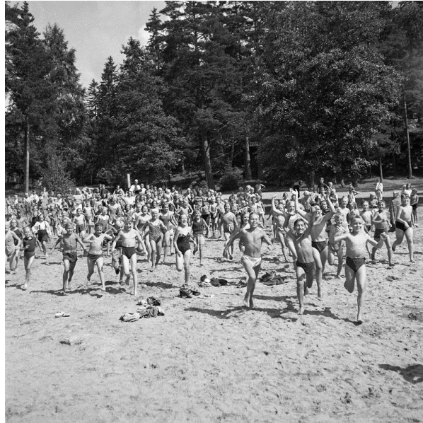
Badsugna barn på Flatenbadet, 1944.

Under 1940-talet utgavs skoltidningen Vi och vår skola vid Riksby folkskola, med artiklar av eleverna (folkskola motsvarar dagens grundskola). I Stockholmskällan kan du finna bland annat 1946 års utgåva. Vad kan en skoltidning säga om dåtidens skola, barn, ungdom och samhälle?