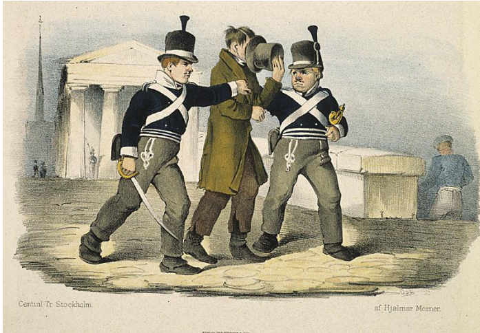
Korvar av Hjalmar Mörner, 1815-37. Stadsvakterna kallades ofta ”korvar” på 1800-talet.