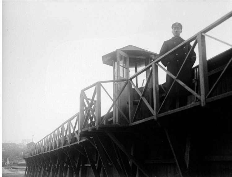
Vakt utanför en vaktkur på muren runt Långholmens fängelse, 1910-talet.

När en strafffånge släpptes fri från Centralfängelset på Långholmen runt sekelskiftet 1900 så skapades ett biografiskt blad om fången. Bladen samlades i så kallade porträttrullor, och innehåller fotografier på straffångarna. I rullorna finns dessutom uppgifter om utseende, födelsedata, när fången började avtjäna straffet, från vilket fängelse han överförts, när han släpptes fri och vart han skickades samt hur mycket pengar han tjänat in under vistelsen på Långholmen. Din uppgift är att undersöka hur porträttrullorna kan användas som historiska källor!