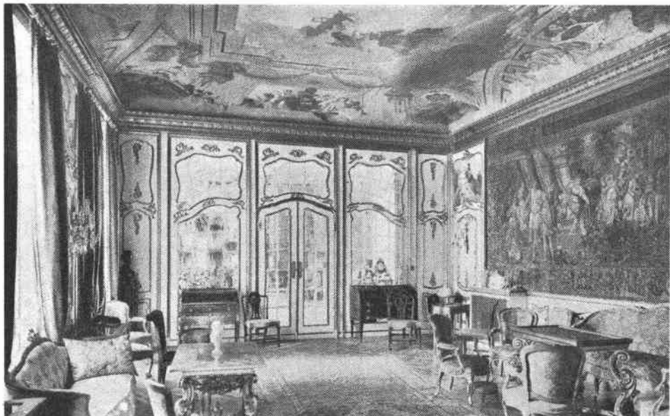
Stora salongen i övre våningen, helt nyinredd vid restaureringen 1903—1905. Vägghpanel i rokokostil, plafonden målad av Vicke Andréén. På väggen till höger en gobeläng från 1600-talet. Dörröverstycke kopierat från Stockholms slott. Genom glasväggen ser man vinterträdgården.