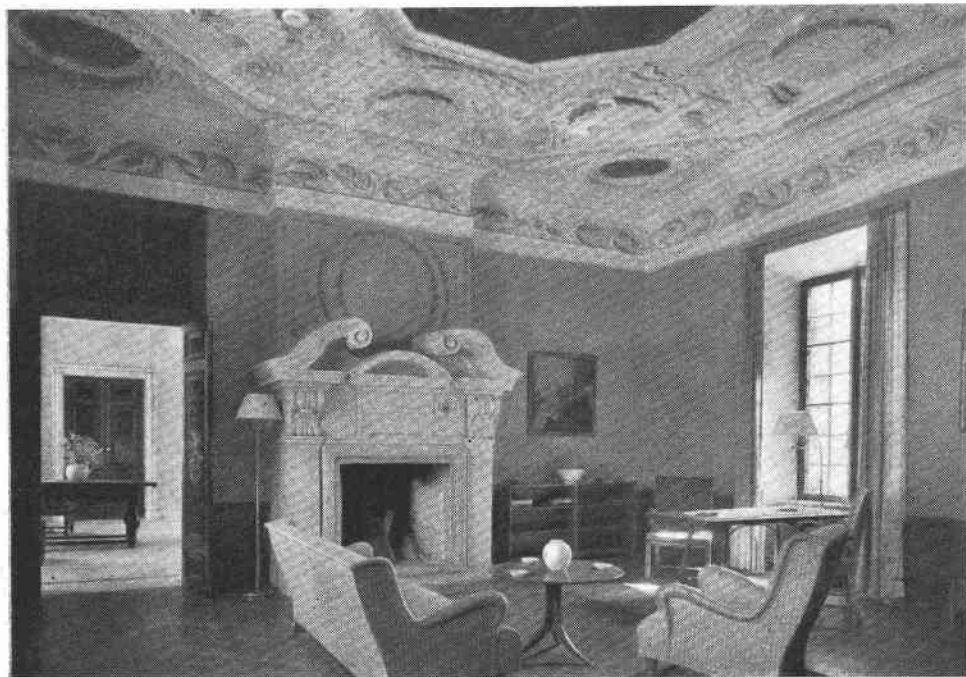
Ovanstående salong efter den senaste restaureringen. Den fasta inredningen är som synes bibehållen, men väggarna ljusmålade. Möbleringen är utförd efter ritningar av arkitekt Rolf Engströmer. Foto Stadsmuseet 1944.