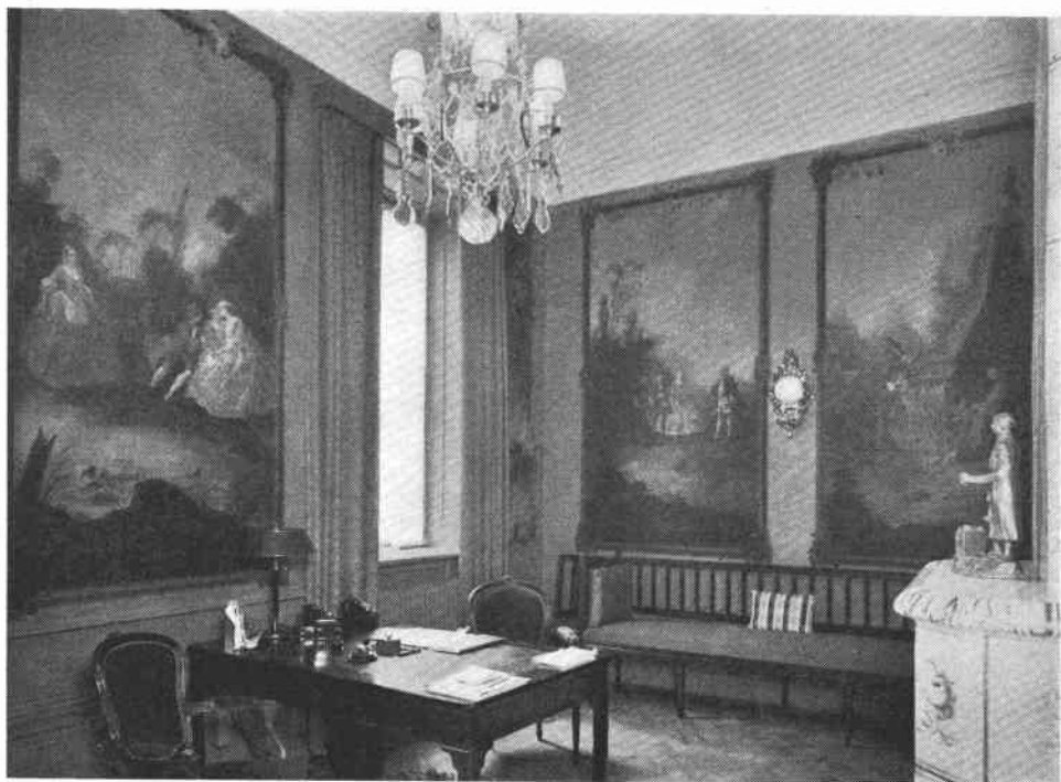
Kabinett i övre våningens östra flygel. Målade vävtapeter från 1700-talets mitt med bildframställningar, symboliserande de fem sinnen.