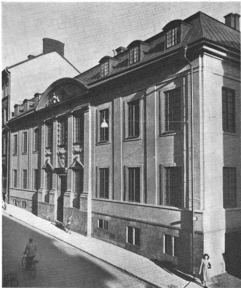
Van der Nootska huset, fasaden mot S:t Paulsgatan. Som synes vid jämförelse med Sueciabilden (sid. 12) är fasaden bibehållen i sitt ursprungliga skick. Framför entrén fanns från början en dubbelarmad fritrappa. Det gamla sadeltaket, vilket synes på Sueciabilden, har under 1700-talet ersatts med ett brutet tak.