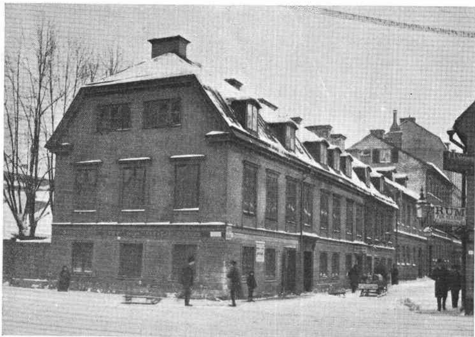
Fig. 3. Hörnet av Klara Strandgata (nuvarande Vasagatan) och Mäster Samuelsgatan, kvarteret Riddaren 3 (jfr fig. 2).

var Ringström som anlade den stora trädgård, vilken fanns kvar här till slutet av 1800-talet, då träden höggs ner och ersattes av posthusets röda stenmurar.