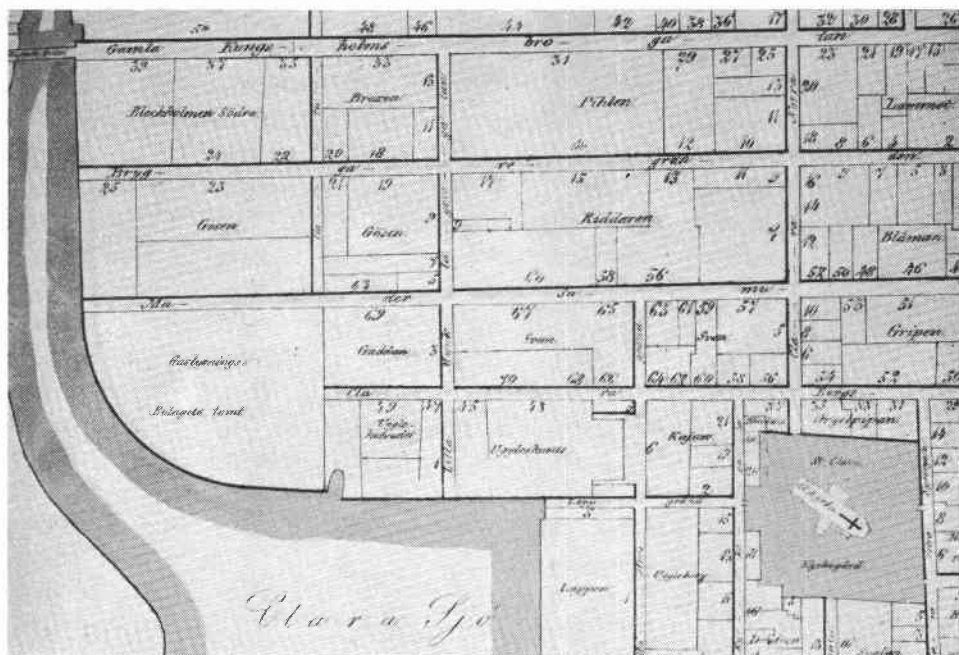
Fig. 1. Detalj ur C. J. Küsels karta över Jakobs församling, 1853, som visar kvarteret Riddaren före regleringarna i samband med järnvägens framdragande. Meisters Gränd (Klara Strandgata) som i breddat och utdraget skick blev Vasagatan, stannar söder om kvarteret och Klara Sjö går upp över nuvarande Centralplan.