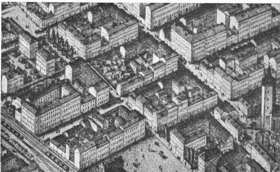
Fig. 5. Detalj ur H. Neuhaus' panorama över Stockholm 1875. Jfr kartan fig. 2. Nedtill Centralplan och t.v. järnvägen. Upp till t.v. den påbörjade Vasagatan som fortsättes av den smala Klara Strandgata till Centralplan. Kvarteret Riddaren ligger ungefär mitt i bilden och dess västra del uppfylles av en stor trädgård.

komplexet skulle rymma bostadslägenheter. Neuhaus' panorama ger besked om den färdiga byggnadens utseende (fig. 5).