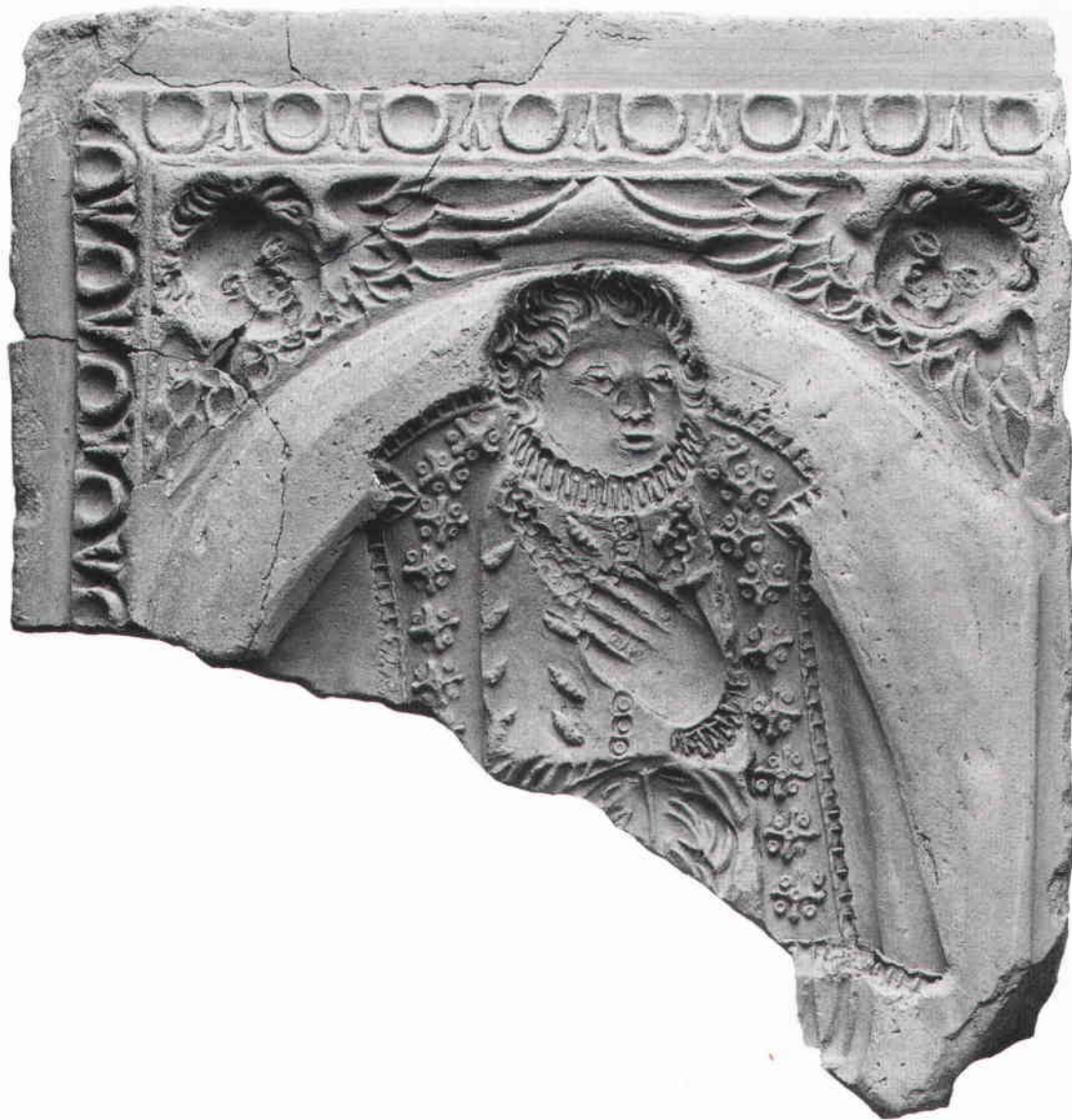
Ovan: Del av kakelmatis i rödgods tillvaratagen i kvarteret Björnen 1978. Nästa sida: Situationskarta över nedre Norrmalm. Den svarta linjen visar strandens läge före 1630-talets gatureglering. Teckning Ingrid Leander/SSM.