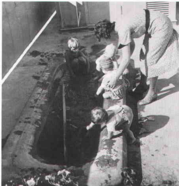
På husets tak fanns solterrass med lekbassäng för de minsta.

Fasaderna fick vid en renovering på 1960-talet en hård cementputs påsprutad och blev snabbt gråa