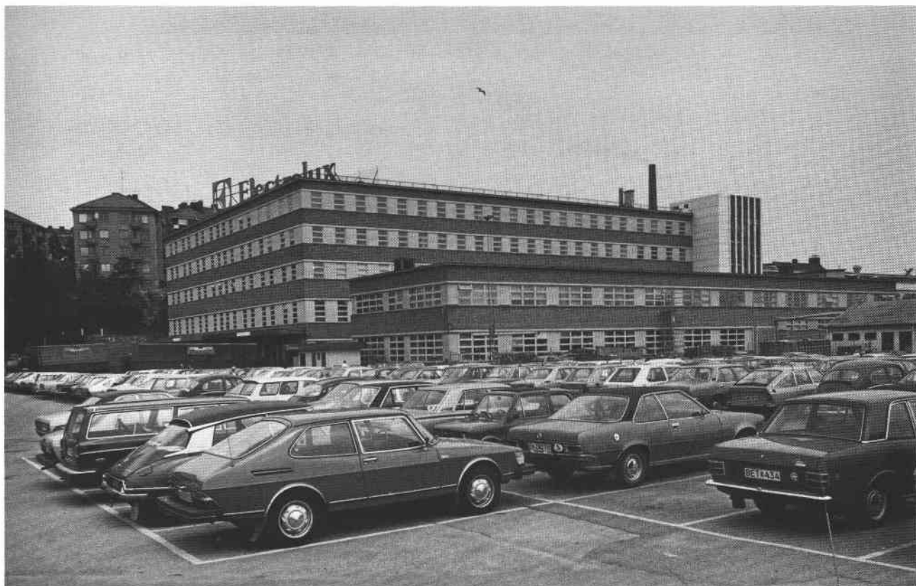
Hus IV och V