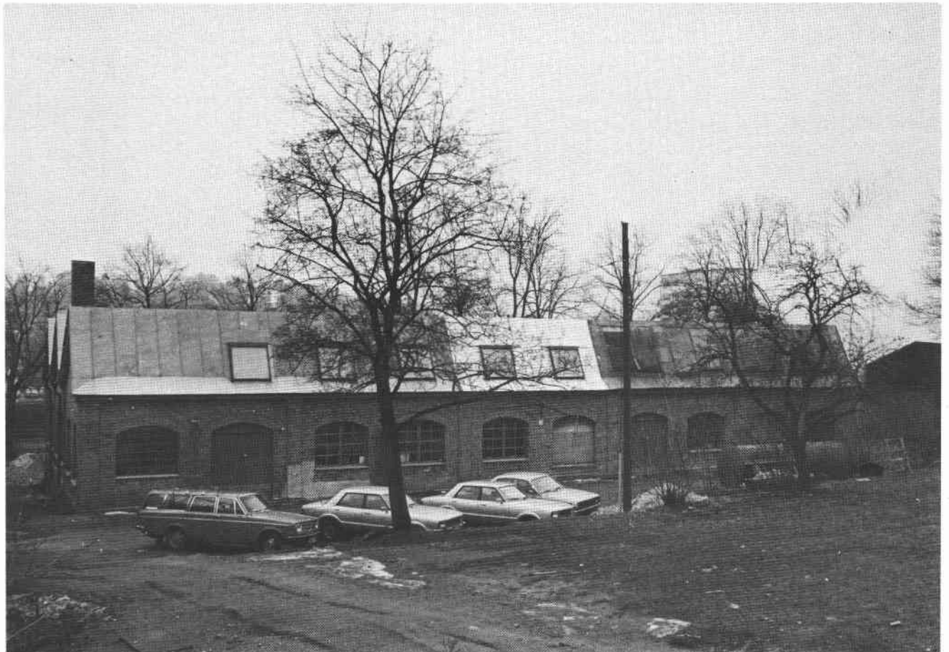
FB 14 550