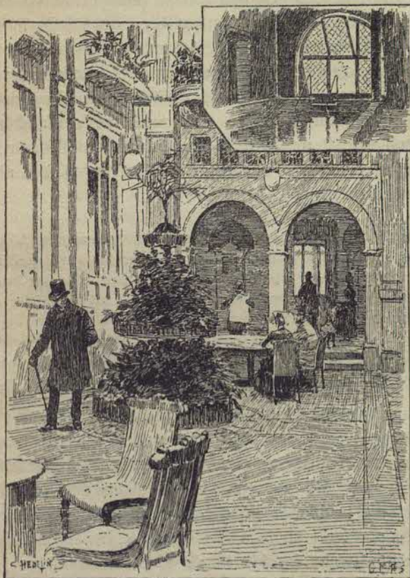
Väntsalen i badhuset vid Stureplan.

Så beger ni er upp i den öfra våningen, där första klassens herrbadrum äro belägna. De rummen ligga på väntsalens högra sida, fruntimmernas på den vänstra. Äfven där uppe är ett litet väntrum med utsigt öfver den stora salen och med ingång till ett kafé. Från korridoren på sångguddinnornas avfigsida inträder man i första klassens enskilda badrum, bestående hvart och ett af afklädningsrum och själfva badrummet, det förra försedt med majolikaväggar