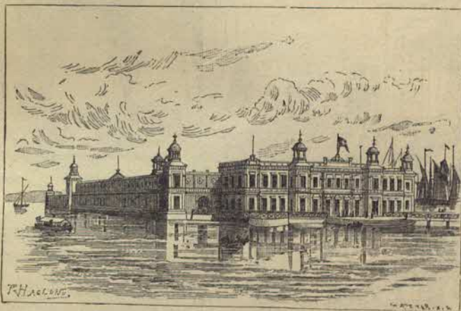
Stockholms stads sim- och badinrättning.