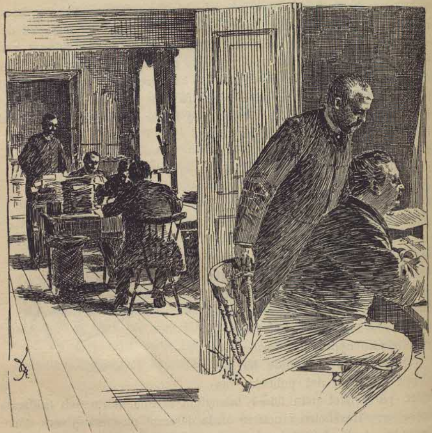
Interiör från Dagens Nyheter.