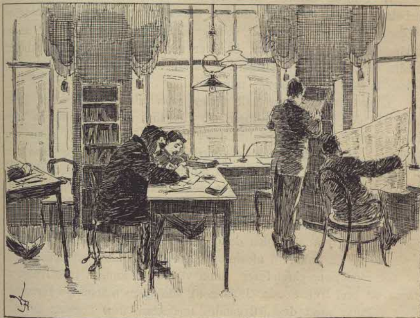
Interiör från Stockholms Dagblad.