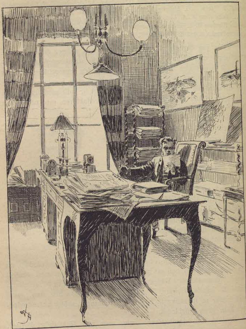
Interiör från Stockholms Dagblad.

en af de förnämsta medarbetarne. Nu äro två af dessa små rum upptagna hvardera af två tidningsmän. I ett finna vi notisafdelningens