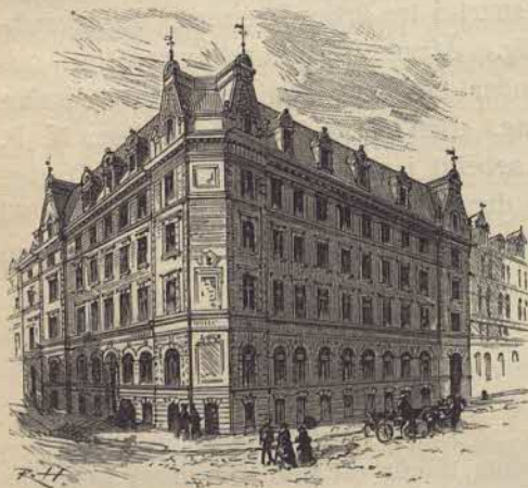
Aftonbladets nya hus.