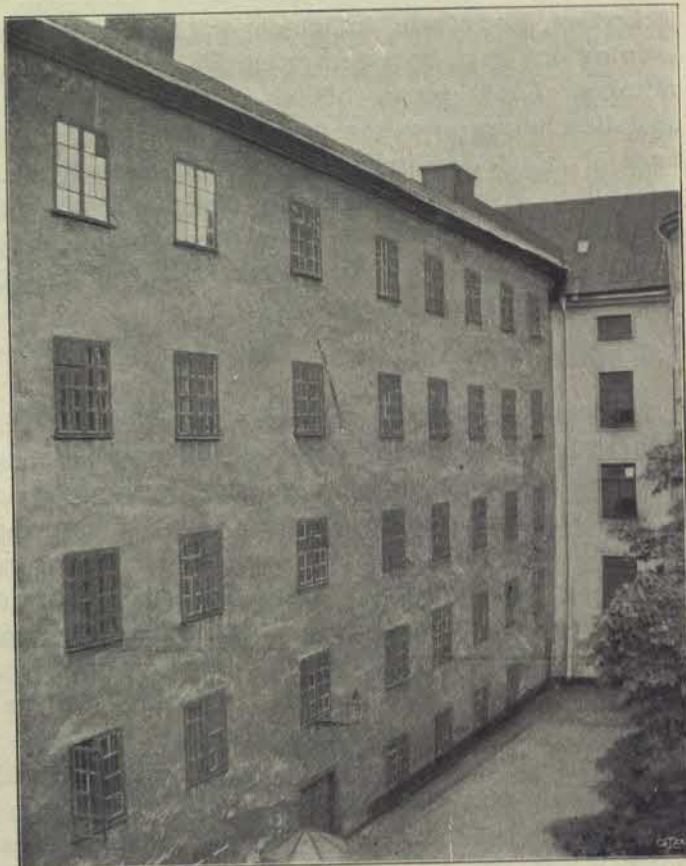
Korrektionshuset å Långholmen. Östra byggnaden.

Genom påbyggnader, som fattigvården 1809 företog, utvidgades åtskilliga lokaler, förnämligast i ändamål att bereda rymligare sofrum och arbets-salar. 1 Nödvändigheten »att hålla de fängslade till sysselsättning och nyttiga yrken» föranledde därefter nya byggnadsföretag. I en af öfverståthållaren 1817 afgifven redogörelse 2 för »Krono Corrections och Arbetshuset å Långhålmen» framhålles särskildt de åtgärder, som för detta ändamål vidtagits. En del verkstäder voro inredda i mindre byggnader vid sidan af det östra logementshuset. Dit voro förlagda, förutom ett större kök, arbetslokaler för snickare, tunnbindare, vagnmakare, målare, bleck- och plåtslagare m. fl. Där fanns äfven en större smedja. I andra delar af anstalten bedrefvos skräd-deri- och skomakeri-arbeten, tillverkning af kläden och tyger, kardning, stickning och sömnad jämte andra arbeten. En yttre gård, tillhörande anstalten, användes för stenhuggeriarbeten, »som af-sågo stadens behof och förskönande».