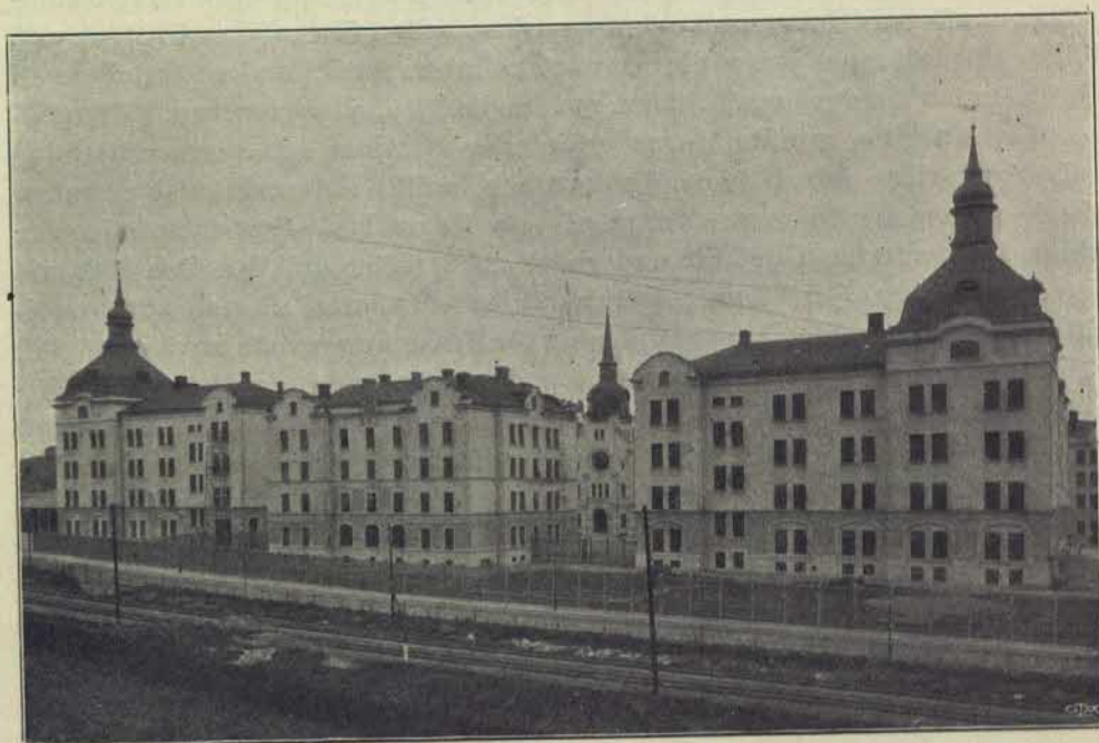
Fasad af den nya Arbetsinrättningen.