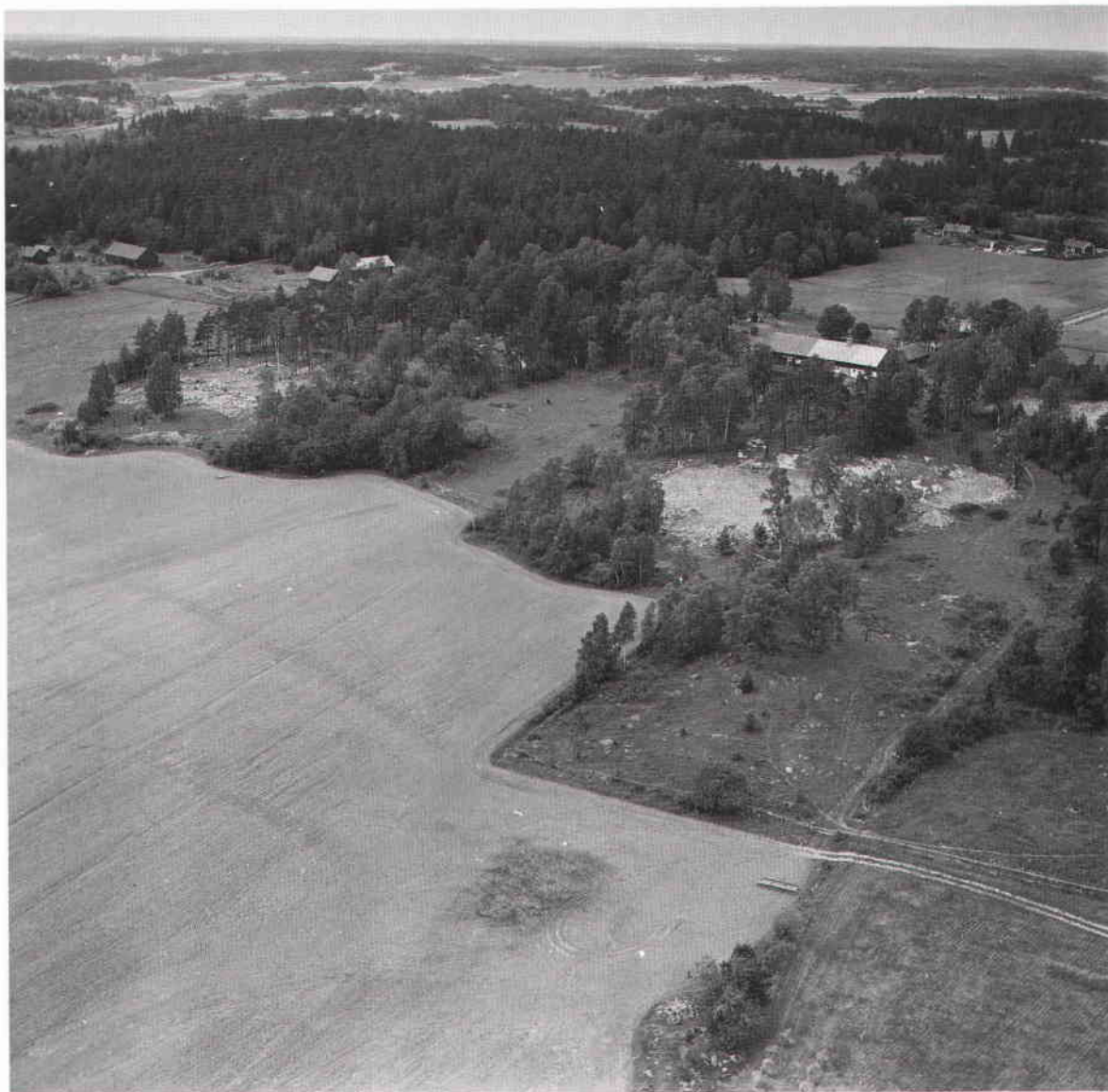
Till vänster: Vikingatida skelettgrav från Ärvinge rekonstruerad i Stadsmuseets basutställning Forntid. Den 60-åriga kvinnan har fått rikliga gåvor med sig i graven. Övan: Vy över Norra Spånga 1965. I förgrunden Lilla Tensta med ett röjt gravfält inför arkeologiska undersökningar, i fonden lägenheterna Erikslund och Henrikslund.