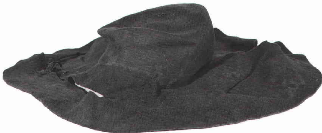
Ovan: Tegelbärrhatt i filt funnen vid Centralplan 1955. Foto Britt Olstrup/SSM. Till höger: Samma typ av hatt bärs av männen i arbetslaget på oljemålningen "Agitation" av Hildur Hult Wählin 1899. Foto Lars Cederstam/Folkets hus.

till deras stora förtret och ilska. Blanche, som föddes 1811, växte upp i kvarteret Snäckan, ett stort kvarter intill Mälarhamnen vid Rödbodtorget.