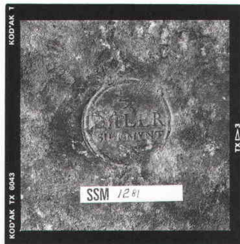
Plåtmynt från 1735, 26 × 23,5 cm, fynd från Götg. 1.

Till vänster: John Söderberg med fynd från Riddarholmskanalen.