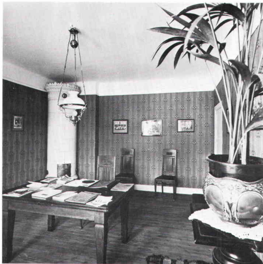
Rum i utställningen med inredning från sekelskiftet Foto Stockholms stadsmuseum, Göran H Fredriksson 1975

I andra halvan av huset visade byggnadsforskningsinstitutet på förändringen i stadsplan, trafik, handel och service. Här gavs även byggnadstekniska och arkitektoniska synpunkter på mark och grundläggningsförhållanden. Ett konkret förslag för just utställningshuset visade ett tänkbart tillvägagångssätt vid