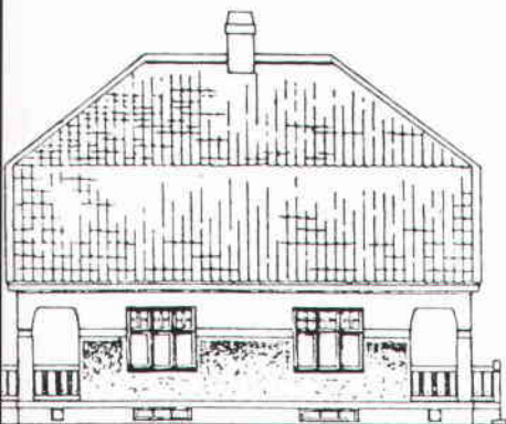
Ritning till enfamiljs dubbelhus 1909. Arkitekt troligen R Arborelius.

Kontakter från stadsmuseet med en forskningsgrupp för ombyggnadsfrågor på Statens institut för byggnadsforskning resulterade i ett samarbete. Utställningen kom därigenom att innehålla två bitar som placerades i var sin halva av huset. Stadsmuseets del visade hur området planerades och byggdes ut till ett