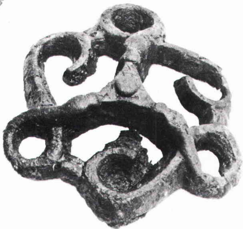
Schalspänne med slingrande ormar. Skala: uppförstorad ca 1 gång.