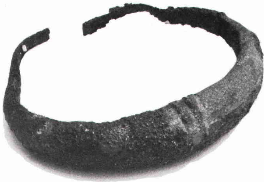
En av de båda armringarna med kraftig tvärgående svulstoring. Skala: uppförstorad ca 1/3:dels gång.

na, är det författarens mening att det kan ha en östlig påverkan eller ännu hellre importerats från något av våra östliga grannländer. En hypotes, som återstår att bevisa.