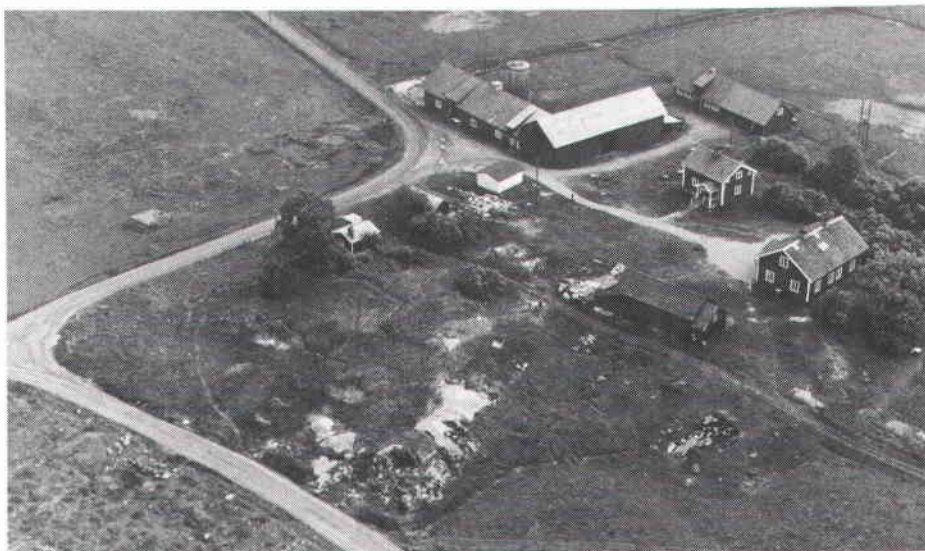
Ärvinge bytomt sedd från NV.

Gården är dokumenterad i urkunder från medeltiden. Första gången omtalas namnet i ett gåvobrev från 1323 som "heruinge". Gårdsnamnets efterled -inge avspeglar en bebyggelseutveckling, som enligt ortnamnsforskare skulle ha bildats under romersk järnålder (ca 50—400 e Kr). I närheten av Ärvinge har vid tidigare undersökningar påträffats både gravfält och boplatzlämningar, som troligtvis tillhört gårdens förhistoria.