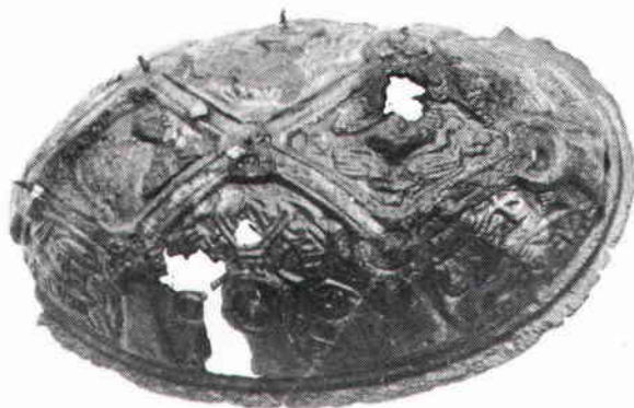
Oval spännbuckla. Skala ca 1:1.

Troligtvis hade vår kvinna en schal svept över axlarna, ihopfästad med ett runt, genombrutet spänne. Spännet har ingen känd motsvarighet inom svensk smyckekonst. Frågan är varifrån det kommer. Att döma av formen och de ormliknande kropparna, som slingrar om varandra och biter i en centrumkär-