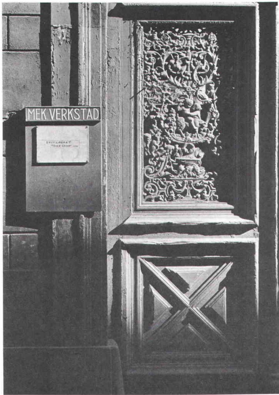
Portal, Klara Norra Kyrkogata 20.