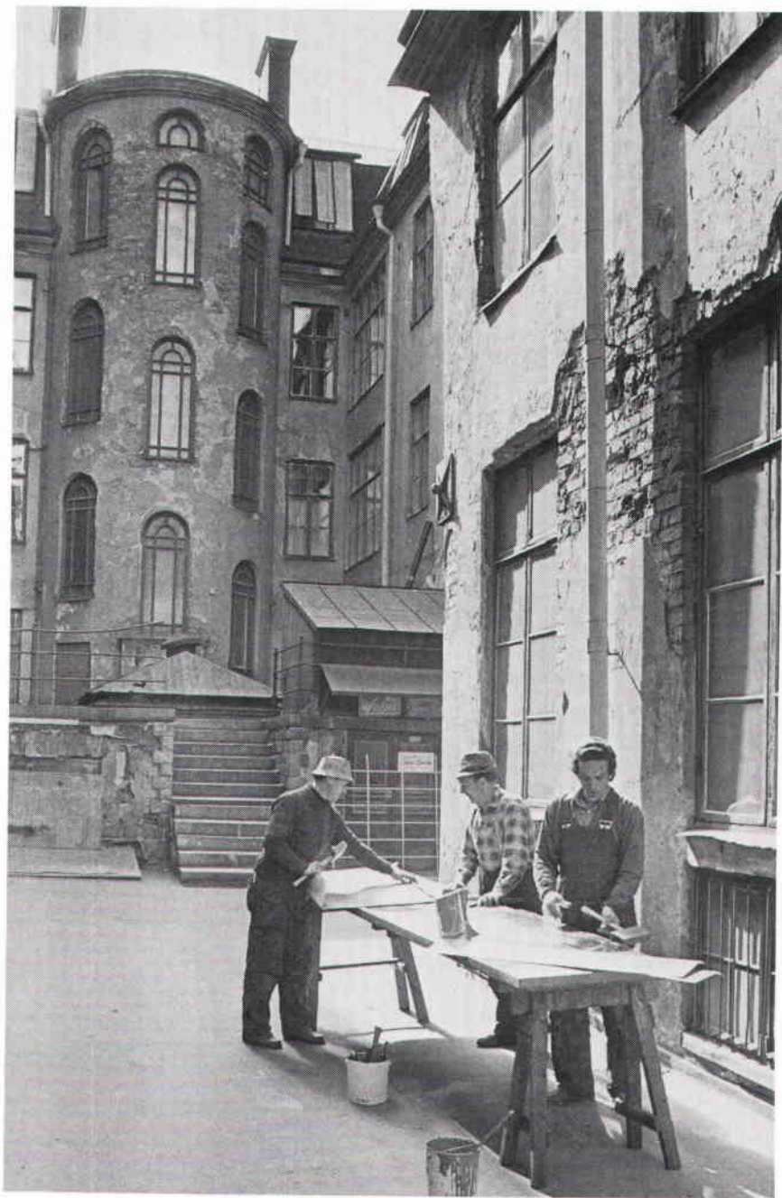
Plåtverkstad Bryggargatan 5. Kvarteret rymmer två plåtslagerier som aldrig behöver sakna arbete.