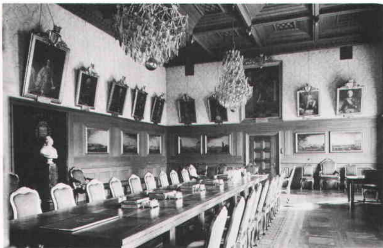
Rådhusets stora magistratssal.

bataljoner av Södermanlands regemente slog tillbaka ryssarnas anfall vid Baggensstaket. Lorentz Pasch d ä har målat porträttet av Fuchs i segerviss fältherrepose. Rutger Fuchs har långt senare (1912) hedrats med att få en gata på Södermalm uppkallad efter sig.