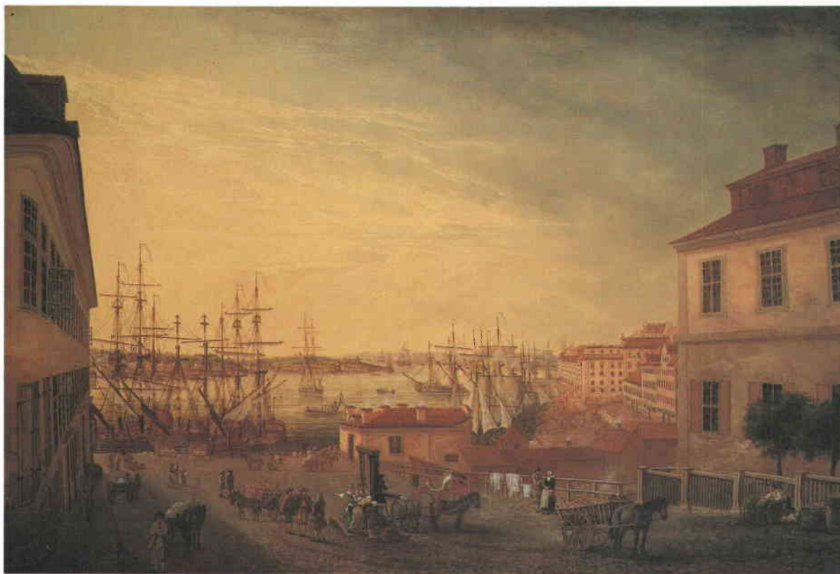
Utsikt från Brunnnsbacken över Saltsjön. Oljemålning av Johan Sevenbom 1773.

des, föreställer ett stiliserat arvsträd med arvlätaren i mitten. Runt omkring trädet finns texter som ger ytterligare råd och anvisningar.