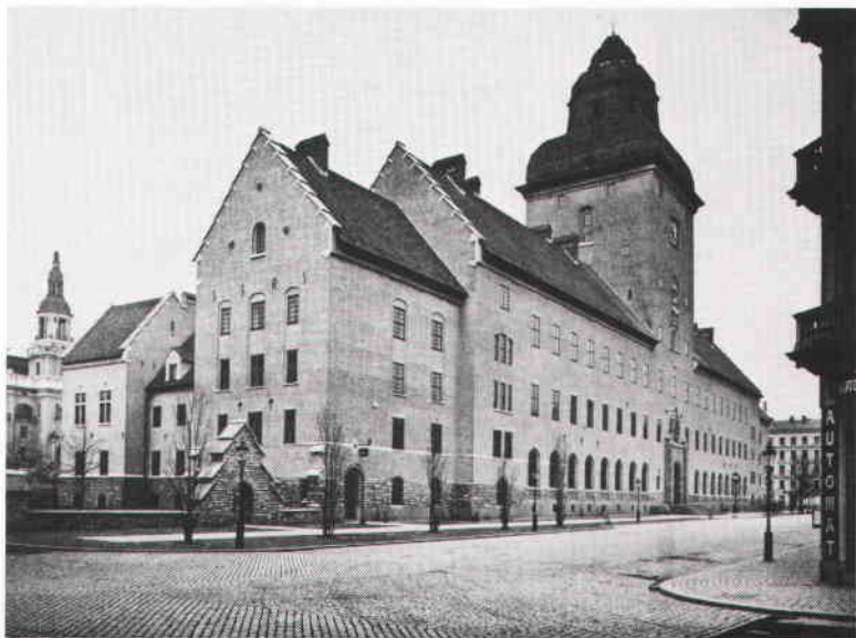
Rådhuset vid Scheelegatan. Foto 1920.