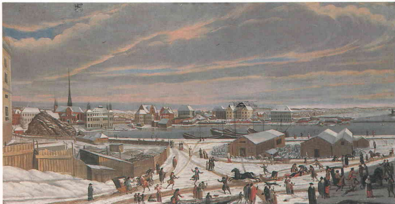
Vintertavlan (Slädolyckan). Oljemålning av okänd konstnär, 1700-talets början.

Förutom dessa Stockholmsmålningar fanns i rådhuset åtskilliga andra tavlor, huvudsakligen sviter av porträtt av överståthållare, borgmästare och andra betydande män i staden. En del av tavlorna kom från rådhuset vid Stortorget. Bland dessa kan nämnas den målning som brukar betraktas som rådhusets äldsta inventarium, den så kallade Arvstavlan, utförd 1536 av Urban Målare, som även målat Vadersolstavlan i Storkyrkan. Olaus Petri lär ha tagit initiativet till att dessa tavlor kom till. Arvstavlan, som skulle vara till ledning när arvstvister avgjor-