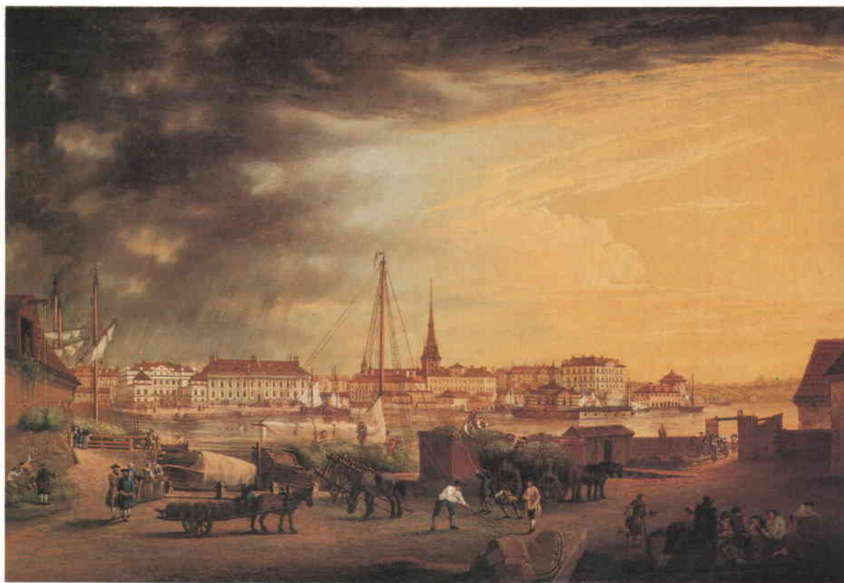
Utsikt från Röda bodarna över Rådhuset (Bondeska palatset), Riddarhuset och Riddarholmen. Oljemålning av Johan Sevenbom 1768.

konstnärsvän Elias Martin fick avsluta den 1785, året efter Sevenboms död.