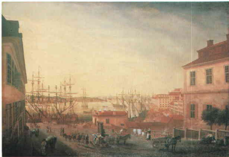
Vid 1700-talets slut var Södra Stadshuset gulrosa, avfärgat med järn- vitriol i likhet med flertalet hus i staden. Oljemålning av J Sevenbom 1773. Tillhör SSM.

Vid fasadrenovering 1984–85 har Södra Stadshuset färgats vitt med grått listverk i enlighet med uppgifter från byggnadstiden 1670-talet. Foto Anna Ulfstrand, SSM 1985.