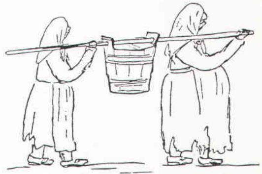
Latrinbärning. Teckning i ett brev år 1828 från F Wöhler till J Berzelius.

De första kända stadgarna om renhållning skrev Gustav Vasa år 1557. Under Drottning Kristinas regering gjordes det första försöket att utföra renhållningen på entreprenad, och i maj 1661 föreskrev magistraten: "Til at föra Oreenligheet aff gatorna, låter staden hålla hästar och kärror, som dagligen gå omkring, Item Pråmar i Hambnen, ther oreenligheeten kan läggias och afföras, til hwilken bekostnadt hwart och et hus i staden gör et billigt förskott". Först i slutet av 1700-talet skrevs det första kontraktet med en entreprenör, angående avträdes- (= latrin-), gårds- och gaturenhållningen. Efter många