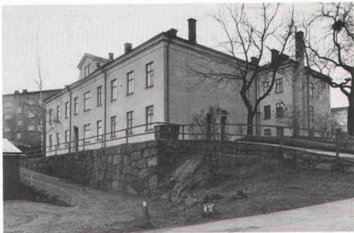
Logementet för hämtningsarbetare och drängar används idag som bostadshus. Foto 1984.