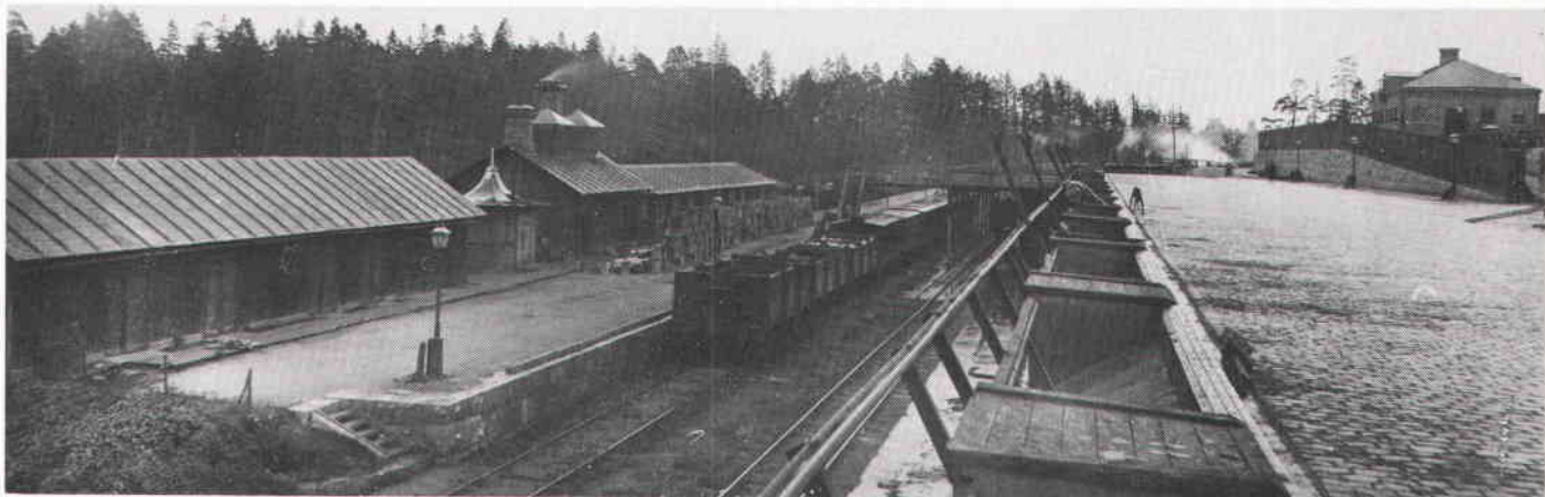
Lastkajen och spårområdet omkring 1908–10. Till höger skimtar sjukstallet.