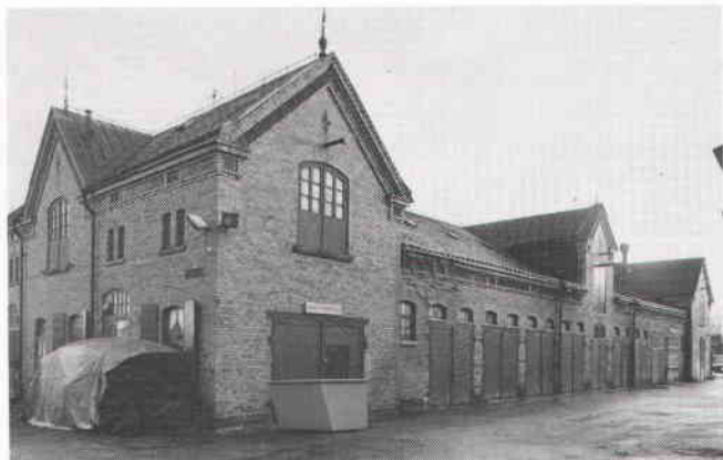
Stallet har förändrats i bottenvåningen på grund av att traktorer inte är lika smidiga som hästar. Foto 1984.