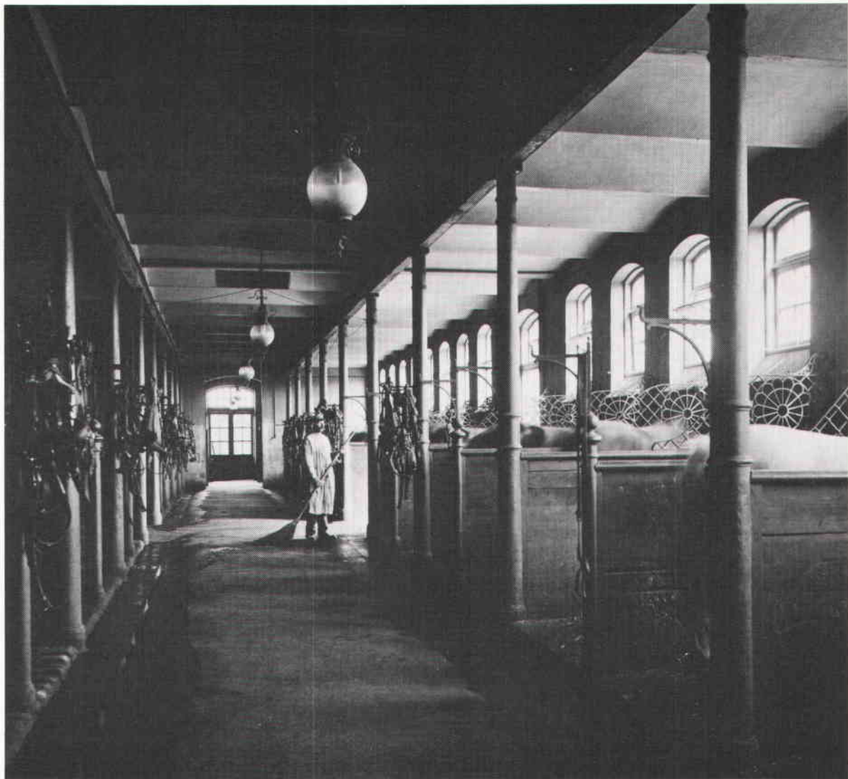
Interiör från gamla stallbyggnaden. Bilden är tagen omkring år 1900. Stallet rymde då spiltor för 72 hästar. Gjutjärnspelare och seldonshängare är bevarade men spilmellanväggarna är idag bortrivna.