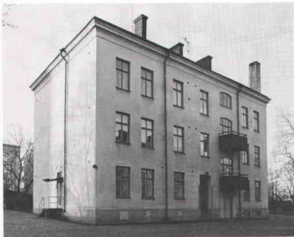
Bostadshuset för befäl vid sopstationen. Detta innehåller idag vanliga bostäder och kontor för gatukontoret. Foto 1984.