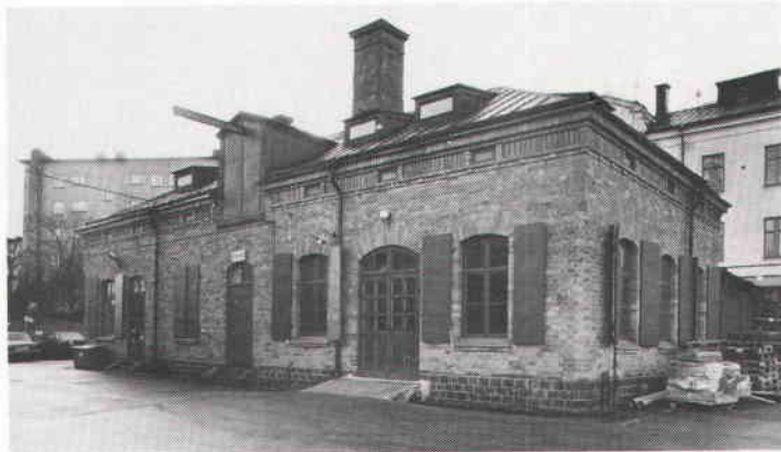
Verkstaden och skoskjulet används idag som snickeri och lager. Foto 1984.

häst och vagn avvecklades vid mitten av 1950-talet.