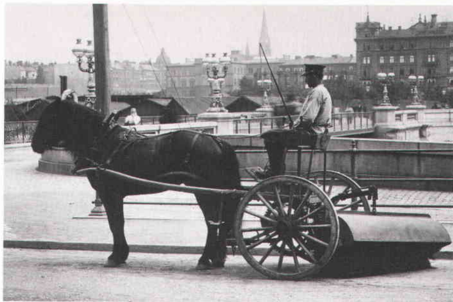
Sopmaskin med häst vid Kungsbron 1896.

hanteringen ligger på entreprenad och latrinhanteringen existerar bara i ringa utsträckning. När Östra stationen anlades omkring 1902 uppfördes ett stall i tegel för 72 hästar, även två mindre hus i tegel: ett sjukstall med en box och tre spiltor samt en verkstad med snickeri och skoskjul med smedja. Därtill kom ett putsat bostadshus för befälet och ett putsat logement för hämtningsarbetarna och stalldrängarna. Två stora och två små vagnslider uppfördes efter hand. Mellan bostads- och logementsbyggnaderna och stallet planterades ekar. Den ursprungliga bebyggelsen är bevarad, endast tre vagnslider har försvunnit genom åren. Stallet används idag såsom garage för traktorer, sopmaskiner, kärror m.m. I norra delen av stallet tillverkas den traditionella sopkvasten av björkris och idag med plastslag, för den manuella gatusopningen. Sjukstallet innehåller ett borstbinderi, där borstarna till sopmaskinerna tillverkas. Denna typ av borstar har tillverkats på Östra renhållningsstationen sedan 1911. I verkstaden finns snickeriet kvar, smedjan med äsja är