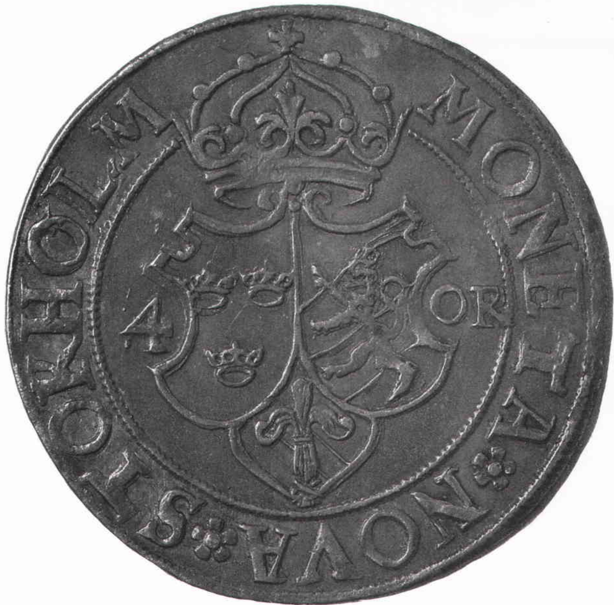
1/2 mark av silver, 1575, med Johan III:s bild. Myntorten anges i frånsidans omskrift MONETA NOVA STOKHOLM (Nytt mynt från Stockholm). Diameter 28 mm.