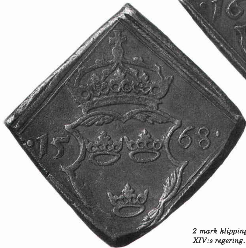
2 mark klipping av silver, 1568, präglad under Erik XIV:s regering. Valören är 16 OR. Mått 27 × 27 mm.

Dalern kostade 1563 4½ mark rundmynt, men genom nedsättning av finvikten kostade den 1568 8 mark klipping.