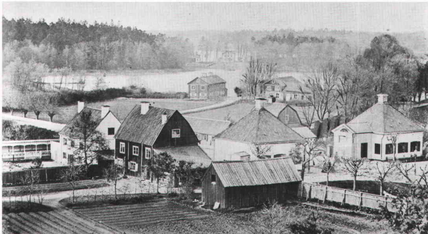
Norrtull och Stallmästargården. Foto C J Malmberg 1860. SSM.