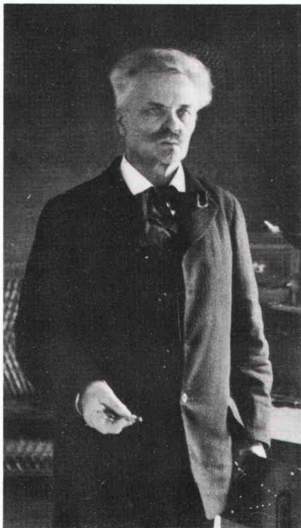
August Strindberg i Blå tornet.

Humoristen och språkbehandlaren Strindberg! Det är en text med livsglädje, som också finns i författarens beskrivningar av barndomens kälk- och skridskoåkning utåt Brunnsviken och Haga. Här erövrades grundkunskaperna om naturen och dess under, som följer författaren både praktiskt och teoretiskt genom livet, exempelvis som i "Tjänstekvinnans son":