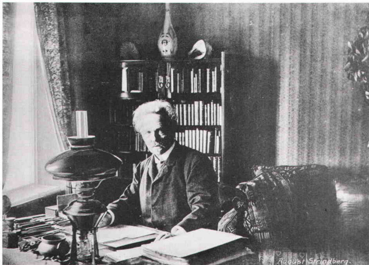
Strindberg i sitt arbetsrum i Blå tornet. Foto Carl Sandels jr 1911. Nordiska museets arkiv.