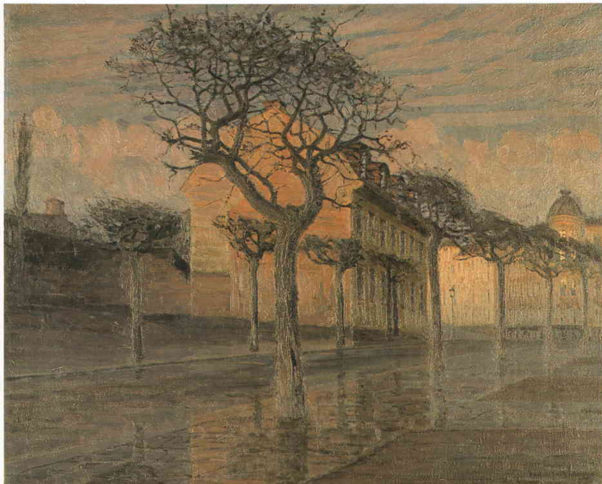
Norrtullsgatan. Oljemålning av Aron Gerle 1907. Tillhör SSM.

”Vi råkas i lövsalen till världshuset... om en stund.”