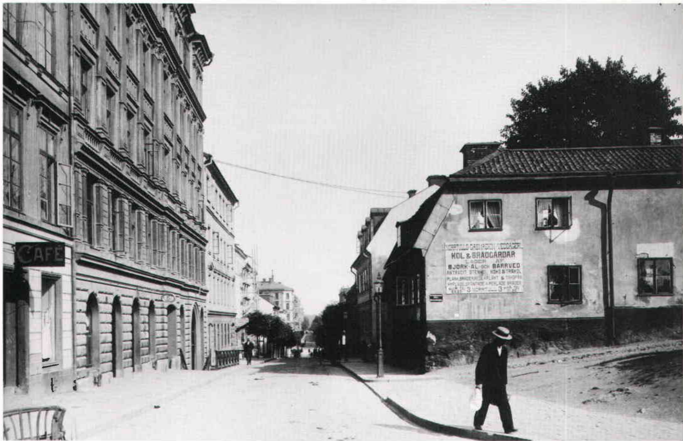
Norrtullsgatan 1-3 år 1901.

författaren dramat "Brända Tomten" med dess svarta humor.