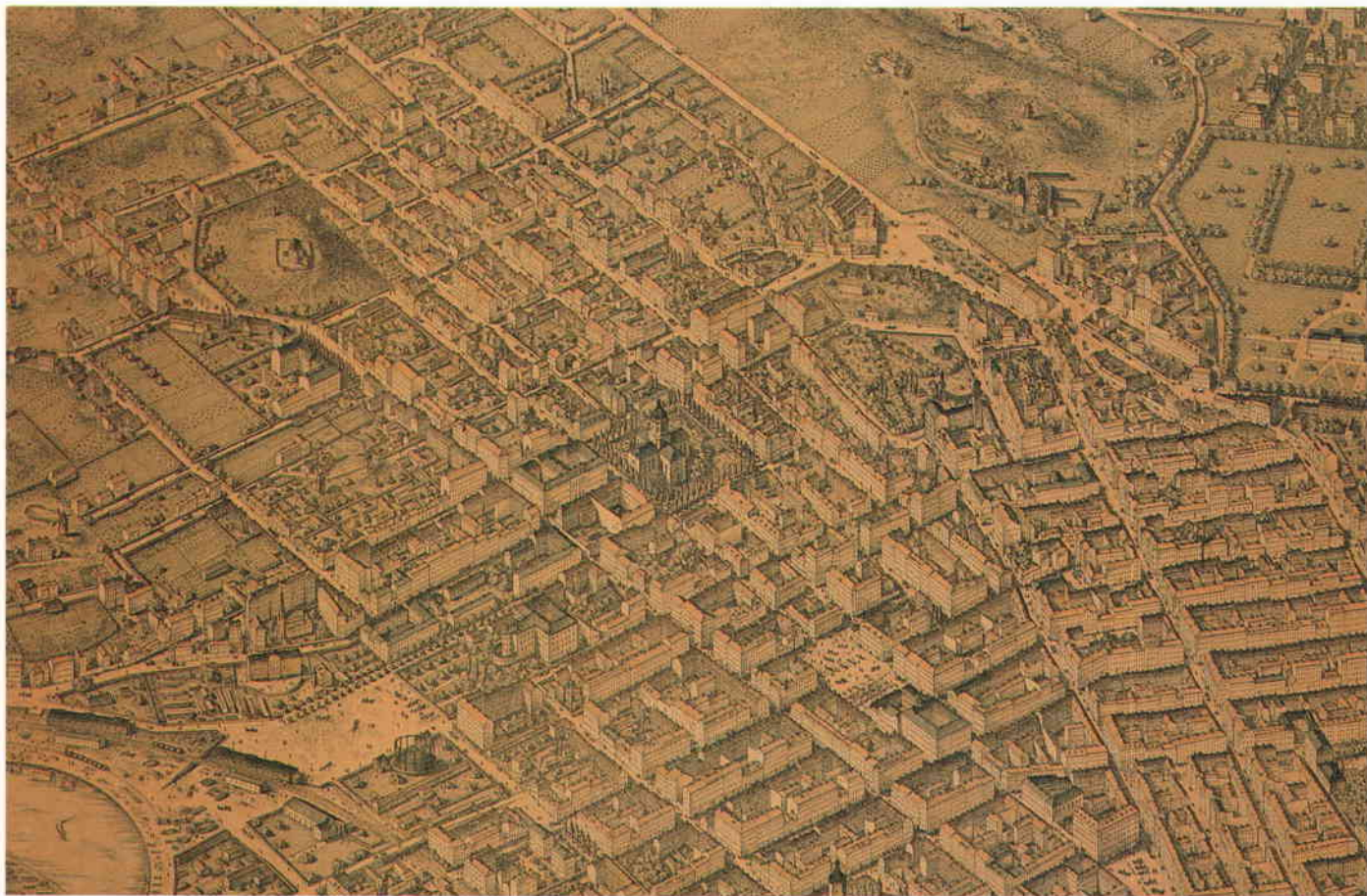
Området kring Drottninggatan och Norrtullsgatan. Utsnitt ur panorama av H. Neuhaus, 1870-talets början.