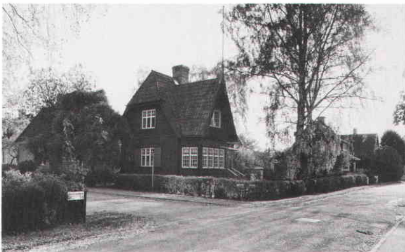
Gamla Enskede, en trädgårdsstad planerad i kommunal regi och utbyggd omkring 1910. Foto Ingrid Wilken 1988. SSM.