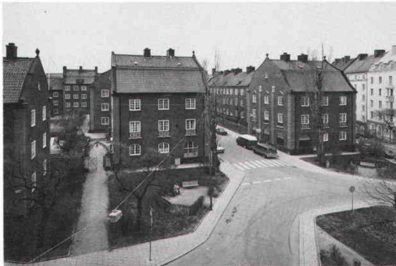
Kvarteren Motorn och Vingen i nordöstra Vasastaden rymmer de första bostadshus som uppfördes med kommunalt stöd av Stockholms Kooperativa Bostadsförening (SKB). Foto Ingrid Wilken 1988. SSM.