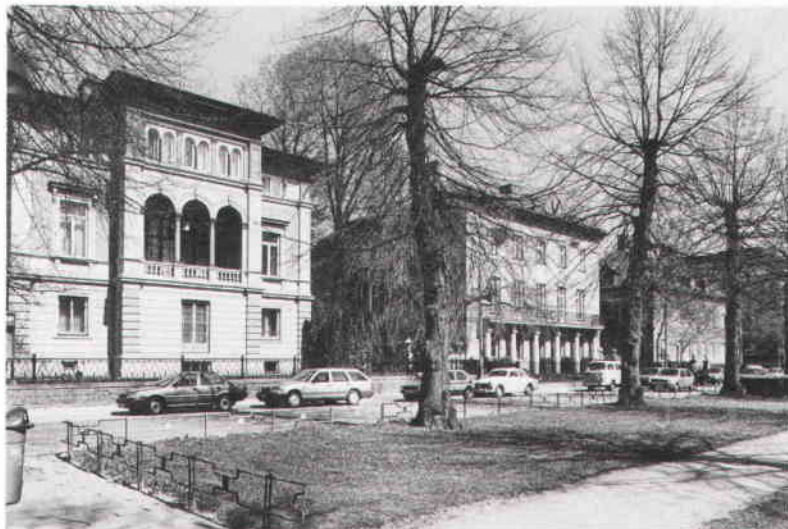
Villastaden planerades på 1870-talet efter engelskt mönster med fristående villor indragna från gatan och planterade förgårdar. I förgrunden Karlavägen, en av de viktigaste esplanaderna från 1800-talets andra hälft. 1988.

För vissa enhetliga områden är det relativt klart vad som måste tillgodose för att den värdefulla karaktären skall kunna bibehållas. En arkitektonisk utformning som berättar något väsentligt om de ideal och föreställningar man haft för tex ett bostadsområdes gestaltning är viktig att bibehålla. Det kan tex gälla volymer, material och yttre färgsättning, egenskaper som är lätta att precisera i särskilda bevarandeföreskrifter i detaljplan. Det kan