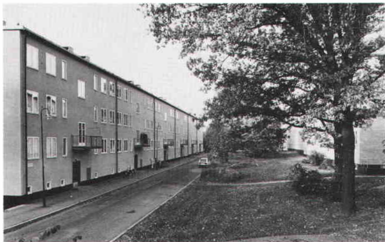
Bostadsområdet Abessinien i Hjorthagen, byggt på 1930-talet av Olle Engkvist efter ritningar av Hakon Ahlberg, är ett fint och välbevarat exempel på funktionalistiskt byggande. Foto Ingrid Wilken 1988. SSM.

också gälla gatuplaneringen och miljön mellan husen. Man kan givetvis alltid diskutera hur långt bevarandebudet skall få göra sig gällande när det t ex gäller ursprunglig lägenhetsfördelning, planlösningar och interiördetaljer, en fråga som ligger utanför den översiktliga riksintresseplaneringen och som skall hanteras genom byggnadslagstiftningen eller ibland genom kulturminnesvårdens speciallagstiftning.