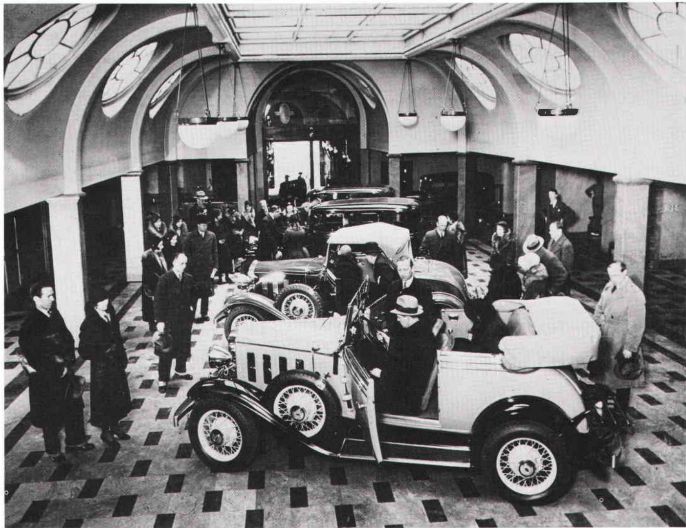
Ostermans bilförsäljningshall 1931.

hyresgästen var Stockholms Rullskridskocenter, som rullade därifrån för gott 1981. Därpå har fastigheten utsatts för en genomgripande ombyggnad för kontor, garage m m. 1930-talets tidstypiska skyltfönster mot