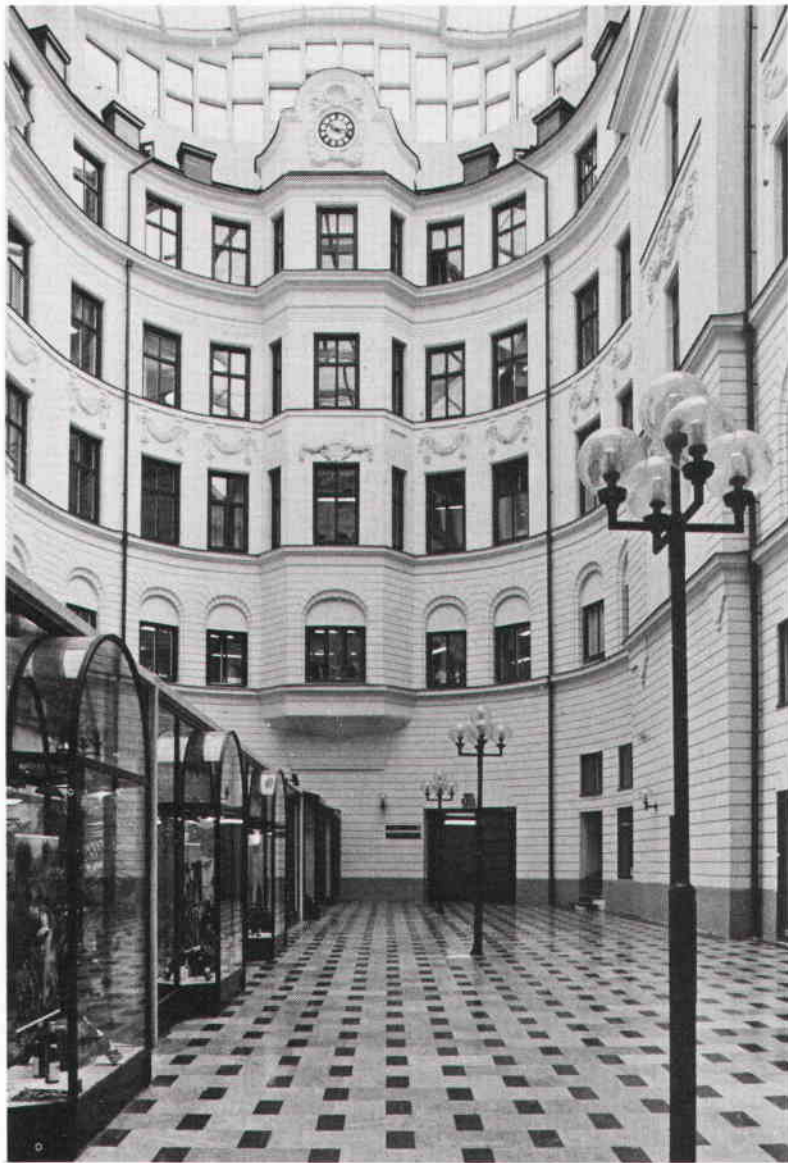
Birger Jarlsgatan 18, gården idag. Det Ostermanska tunnvalvet i glasbetong har tagits bort men det rutlagda marmorgolvet är kvar. Systembolagets utbyggnad skjuter ut på gården, som täckts på nytt. Foto Ingrid Wilken 1988. SSM.

Birger Jarlsgatan har försvunnit. Av Marmorhallarnas ursprungliga inredning återstår endast marmorgolven med sina geometriska mönster, nu i Systembolagets vinbutik och på gården, samt någon enstaka marmorpelare. Den tunnvalvda överbyggnaden från slutet av 30-talet är riven och i stället har den Hagström & Ekmanska gården återfått något av sin ursprungliga utformning – ”ståtlig och imponant” som man tyckte att den var år 1900. Gårdsytan har minskats betydligt eftersom Systembolagets glasade utbyggnad tar närmare hälften av gården i anspråk i en vånings höjd. Dessutom har den på nytt byggts över, denna gång i takhöjd. Den stora tavlan i marmor från 1934 finns dock kvar. När Ostermans flyttade härifrån lämnade man den i huset på villkor att den nye fastighetsägaren, Försäkrings AB Skandia, lät den sitta uppe någonstans. Efter den senaste ombyggnaden har tavlan placerats i entrén från Birger Jarlsgatan, som numera är totalt förändrad. Utrymmet, som är trångt och lågt och saknar lämplig belysning, inbjuder knappast de förbipasserande att stanna upp och läsa och begrunda marmortavlans text. Tavlan skulle göra sig betydligt bättre inne på den stora ljusa gården, ett rum där man idag gärna stannar till. Där skulle den ostermanska marmortavlan få en mer uppmärksam plats, vilket den vore värd – både som ett minne över Marmorhallarnas epok i huset och som ett intressant tidsdokument om bilen.