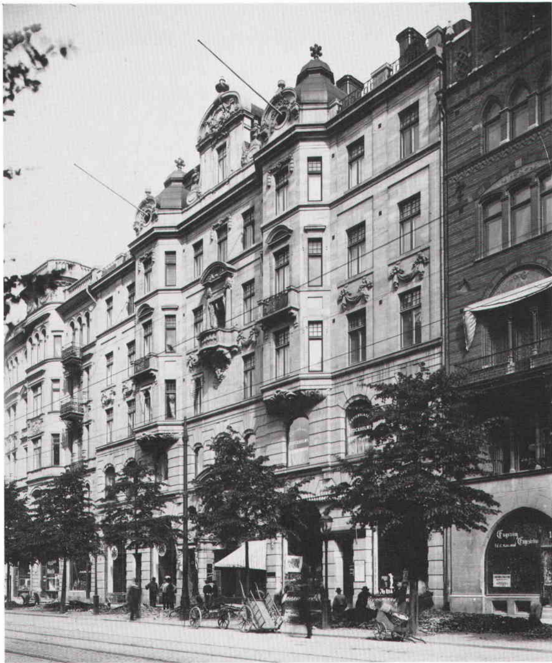
Birger Jarlsgatan 18 innan det blev Oster- mans Marmorhallar. Fasaden är i princip intakt ovanför de två nedersta våningarna, vilka förändrats totalt. Foto omkring 1900.