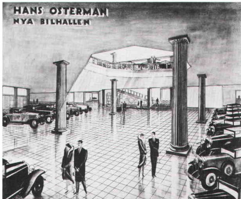
Teckning av Ostermans nya bilhall, omkring 1930. Notera den stora tomma nischen på trappans vilplan, där marmortavlan några år senare skulle fogas in.

Den text som Osterman lät hugga in i marmortav-lan är här återgiven i sin helhet. Det är en översätt-ning till svenska av amerikanen John O Munns dikt The Automobile. Denna hyllning till bilen skrevs av allt att döma redan 1921 och ingick då i några sk "Marketing Plans for the Automobile Dealer", som Osterman stött på under någon av sina många resor till USA eller England. En kraftigt förkortad text fanns även ingraverad på de plaketter av olika slag som bilfirman lät dela ut i samband med jubileet. Ett mindre antal var infällda i fodral av silver, vilka kunghigheter och andra prominenser begåvades med. Vidare präglades ett stort antal plaketter, infällda i ett något enklare fodral. Dessa delades ut till stor-kunder och andra för firman särskilt viktiga perso-ner. Dessutom tillverkades inte mindre än 5000 bronserade fodral för tändsticksaskar (modell större)