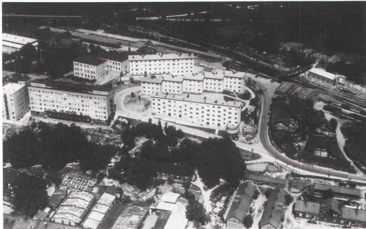
Flygbild över Körbärshagen i slutet av 1930-talet.

Husen på Stickelbärsvägen och Körbärsvägen uppfördes av Stockholms fastighetskontor men övertogs strax efter av det nybildade AB Stockholmshem. Husen är trevånings lamellhus, så kallade smalhus. Alla lägenheter hade centralvärme, elektricitet,