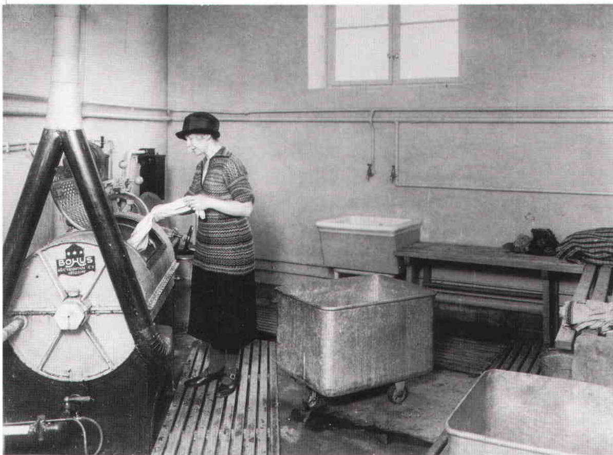
Tvättstuga, mangel och torkrum fanns i källaren på Stickelbärsvägen.

En vårfest hölls varje år i Körsbärgården, områdets barnstuga, i mitten av april. Då sjöngs "Vintern