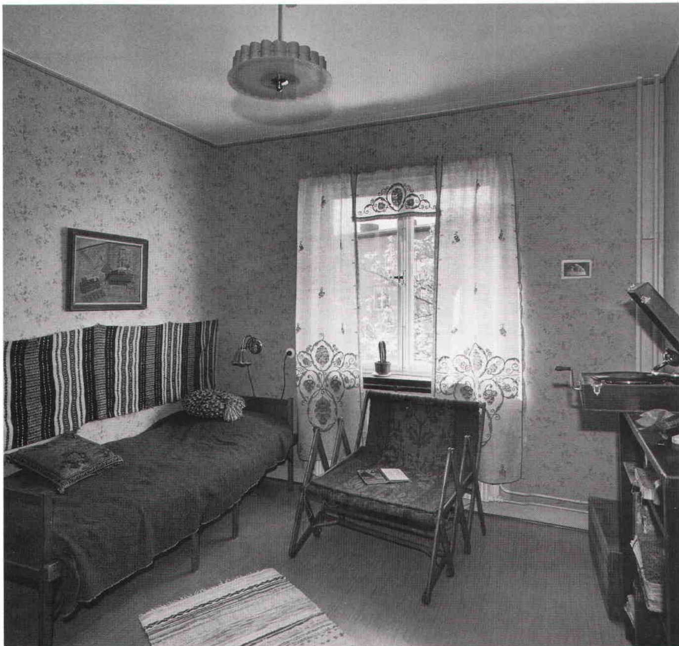
Interiörbild från museilägenheten, sovrummet, efter renoveringen.