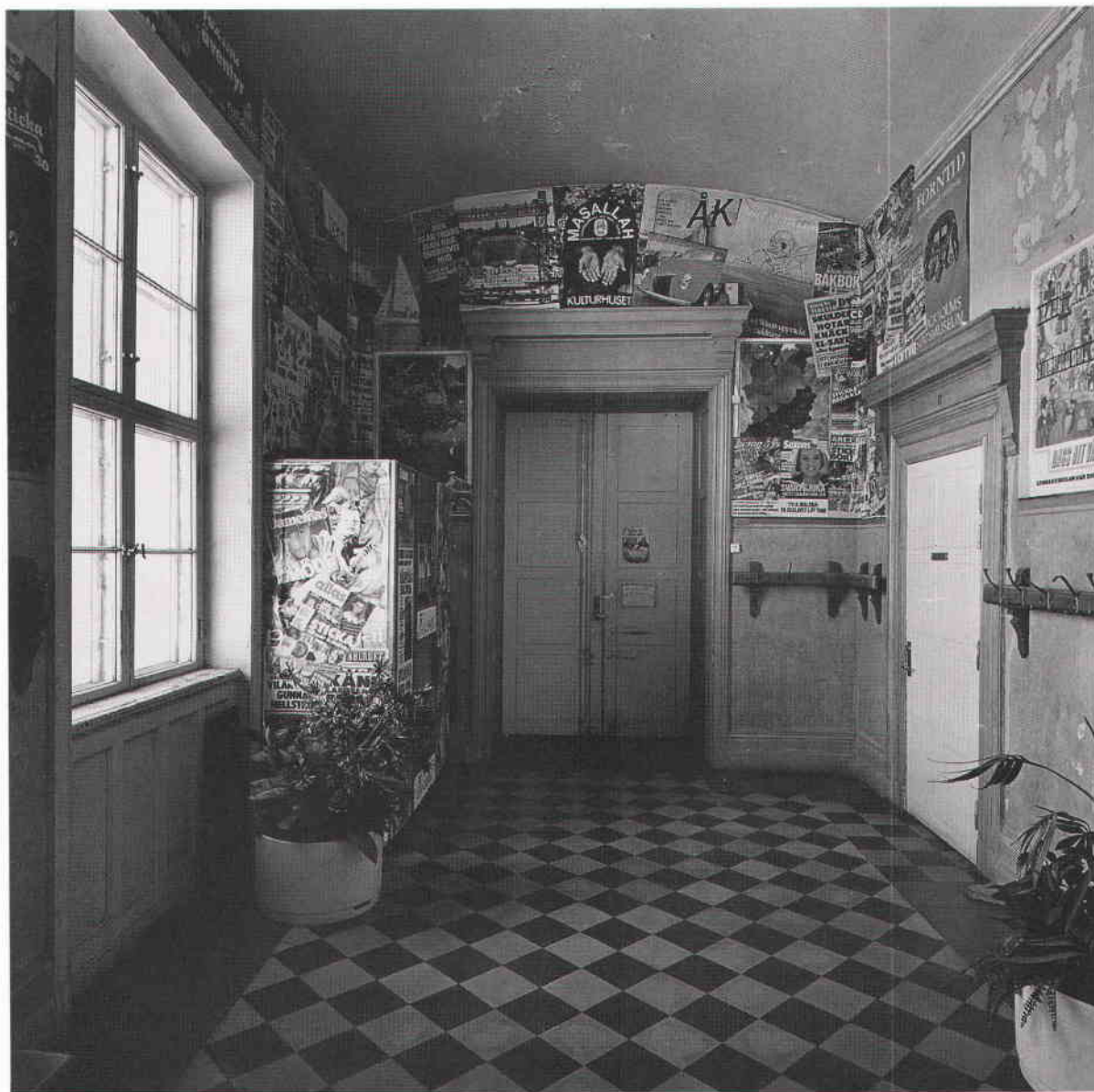
Senare tiders expressiva användning av skollokalerna kan inte dölja byggnadens kvaliteter i den fasta inredningen.