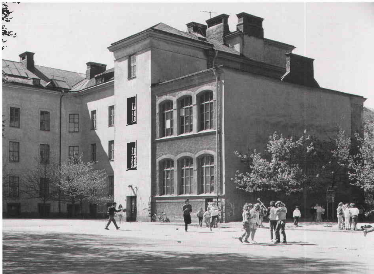
Skolgården är den finaste i innerstaden. Här finns möjlighet till bollspel och lekar eller stora samlingar vid högtidsdagar.

breda, ljusa korridorerna. Därmed hade flickorna startat en rörelse, som inte lät sig hejdas. De lade inte genast märke till den flagnande färgen på väggarna och vattenskadorna från läckande rör utan bara att detta var en miljö, som var upplyftande och skapad för dem.