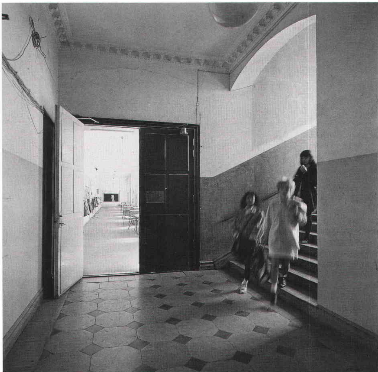
Ännu under vårterminen 1988 hördes ljudet av barn som skyndade genom trappor och korridorer. Foto Göran Fredriksson 1988. SSM.