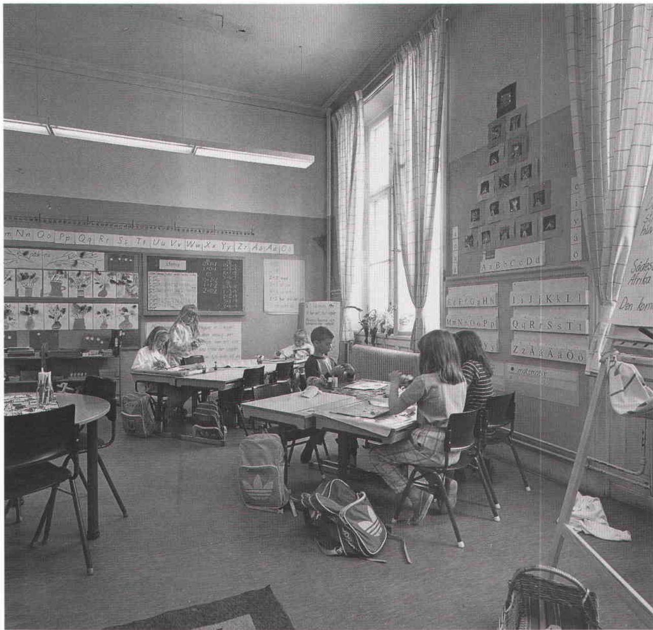
Grupparbete. Foto Göran Fredriksson 1988. SSM.