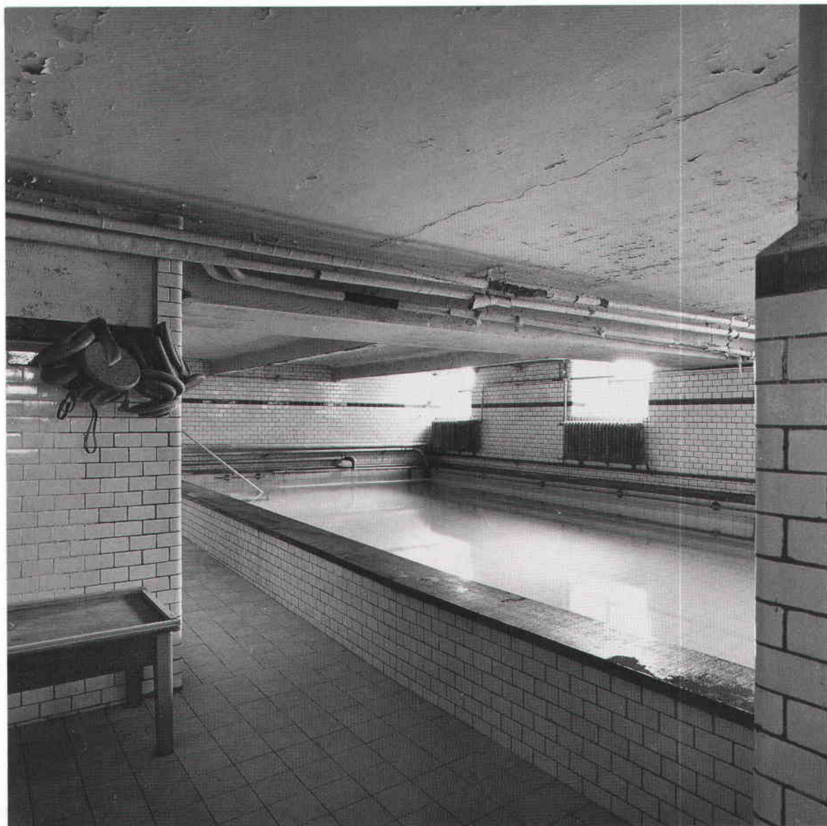
Av skolans två simbassänger användes den ena så sent som 1980. Att färgen flagnar är självklart vid bristande underhåll. 1950-tal.