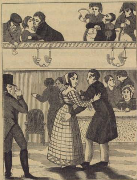
Fig. 35. Uggleviksbalen. Ur Anna Kajsa Frodigs Resa till Stockholm.