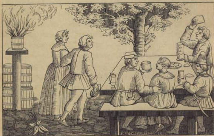
Fig. 36. Midsommarsfest. Efter Olaus Magni.

Det var kanske den första betydande löfmarknaden i Stockholm, en anledning att vid hvarje återkommande fästa ett högtidligt, fosterländskt minne. Om också detta minne ej kunnat i all sin ursprungs-