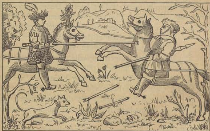
Fig. 31. Tornerspel på första maj. Efter Ol. Magni.

maren skulle öfvervinna vintern. Hvarje afdelning var ifrig om att triumfera, men den gick värst på som den dagen syntes låna sin styrka af väderlekens mildhet eller stränghet. Om den stränge vintern ännu lät känna sin kyla, så lade vinterhöfdingen sina vapen från sig, red fram och kastade på åskådarne med glöd blandad aska som han tog ur en kruka eller en säck. Likaledes togo hans medhjelpare, som uppträdde till häst i samma utrustning, och kastade eldkulor på åskådarne. Men på det sommarhöfdingen och hans ryttare icke skulle af brist på gröna grenar och qvistar beröfvas den eftersträfvade äran, så hade de långt förut tagit björklöf och lindqvistar och låtit dem slå ut i värmen i badstugorna samt låtsade såsom hade denna grönska spruckit ut i skogen, hvarifrån löfven i hemlighet tagits och nu offentligt framvisades.