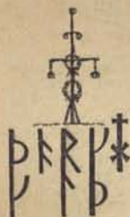
Fig. 32. Majstång. Från Runstafven 1742.

Blomstergrefven var den glade befriaren, äfven om hans sommarutstyrsel tillkommit med ett litet knep. Denne comes florealis uppenbarade sig på många ställen, och hans namn är för öfrigt majgrefve , hvilket namn torde härleda sig icke blott af månaden Maj, utan äfven af det tyska »Mai» som betyder grönt, isynnerhet vårgrönt, hvarefter också majstången uppkallats, men som åtminstone icke hos oss tillhör Maj månad. De svenska värfesterne äro nog släkt med andra lands lustbarheter vid samma tid på året, om de också skulle hafva sin egen prägel och firas med så mycken större glädje, som vår vinters stränghet i vanliga år är större än t. ex. Tysklands och Frankrikes.