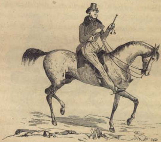
Fig. 34. Första-maj-ryttare. Ur Magasin för konst, nyheter och moder.

Man får hålla sig på vägen, midt i dammet, trängseln och stojet. Kanske att man litet längre fram kan få komma upp i en backe och taga fram smörgåsarne ur piraten. Det finnes nog de som hafva både ägg och pannkaka med sig och en hel butelj bränvin kanske, men det är andra som nöja sig med en smörgås, fastän de kanske sedan gå till tältet der och rumla på färsköl och gräddvåfflor eller