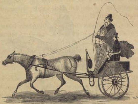
Fig. 33. Den nya giggen. Ur Magazin för konst, nyheter och moder.

Hyrkuskarnes fordon började mot slutet af 1840-talet att täfla med herrskapens egna, stundom till och med att öfverglänsa dessa. Det var slut på de gamla oformliga, osnygga och löjliga »bagarbodarne», och om hyrvagnarne ännu i skämtsamt tal kallades »hyrkajsor», hade aktningen för dem likväl betydligt stigit, och på första maj kunde man med riktig glans visa sig i en hyrkalesch med en