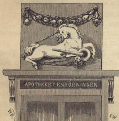
Fig. 79. Apoteket Enhörningens skylt.