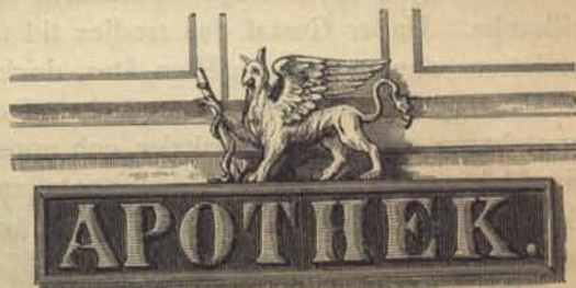
Fig. 84. Apoteket Gripens skylt.

Efter år 1824 har icke något annat nytt apotek än Djurgårdsapoteket inrättats i Stockholm.