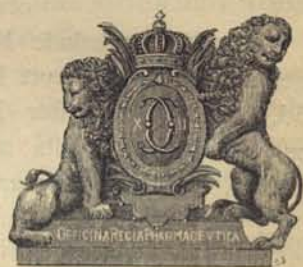
Fig. 83. Apoteket Kronans väggtafla sedan Karl XII:s tid.

slagvatten, viol-, rosen- och andra syruper, m. fl. uppräknade medicinska saker som höra till apoteken. Dessa privilegier förnyades 1683, då materialister, quacksalvare, empirici och andra som stryka ikring landet och sig den ena tiden efter den andra i hufvudstaden uppehålla strängeligen förbjödos att göra de i Stockholm bosatte apotekarne något ingrepp, förfång eller prejudice, hvarför ock slike »quacksalvare och landstrykare» skulle från staden och riket afhållas och ingen tillåtas att »smörja på gemene man sine förfalskade och bedräglige kompositioner». I det för Collegium medicum, 1680, utfärdade privilegium ställes apotekare och barberare under kollegiets inspektion, och förordnades, att en syndicus af »doctoribus collegii» skulle tillsättas för apotekens tillsyn och besigtning. Med de förnyade privilegier för Collegium medicum, hvilka utfärdades 1688, följde också den första medicinal-taxan.