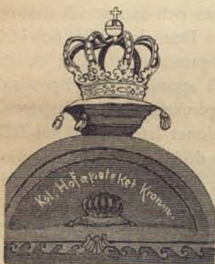
Fig. 82. Apoteket Kronans skylt.

Innan Enhörningen, Hvita Björn och Kronan inrättades, utfärdades, 1675, ett allmänt kungl. privilegium för apotekare i Stockholm, och skulle då ej flera än sex apotek få finnas. Ingen materialist , occulist , operator , bruchsnidare , badare , sockerbagare eller kryddkrämare skulle hafva rättighet att sälja några venera , abortiva , antidota , purgantia composita , aquas tam simplices quam compositas ,