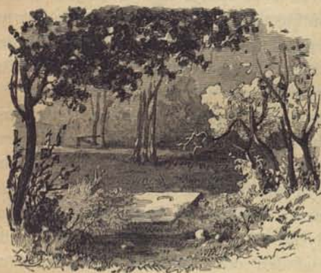
Fig. 76. Den sista grafstenen på Ladugårdslands fattigkyrkogård.

»Den första och hederligaste är deras, som åtnjuta Kyrkogårdarne; de blifva burna af vissa dertill beställda likbärare af Borgerkapet, som af sig komme äro och ingen annan förtjenst för den förderfvade handelns skull veta att tillgå. De hafva nu efter Collegii Medici förslag och Magistratens ordres måst anlägga en särdeles habit