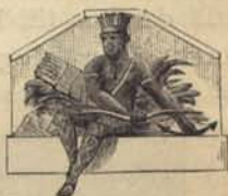
Fig. 78. Apoteket Morianens skylt.

Privilegiibrefvet är af 1649, men knapt en månad efter Bievers bref, eller den 12 Juli 1649, fick tysken Samuel Ziervogel, Maria Eleonoras hofapotekare, privilegium på ett nytt apotek, Svanen . Enligt Sacklén skall detta apoteks privilegium dock ej grunda sig på Ziervogels, utan på Caspar Scheps rättigheter, utfärdade 1650, men Wistrand visar med ett kungabref af 1675, att apo-