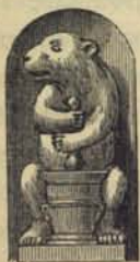
Fig. 80. Apoteket Hvita Björns skylt.

I tidsföljd kommer Hvita Björn på Ladugårdslandet, hvilken stadsdel i slutet af 1600-talet började så mycket bebos, att man der behöfde ett apotek. Tysken Johan Berent fick 1692 privilegium på ett sådant och öppnade det i Lampas hus, i hörnet af Nybrogatan och Smala gränd (nu Gref-Thure-gatans östra del), hvarifrån det sedan flyttades till nu varande n:o 14 vid Nybrogatan och senast till n:o 15, B vid samma gata. Den skylt (fig. 80) vi här meddela är den gamla som satt i en nisch öfver fönstret, då apoteket fans i n:o 14.