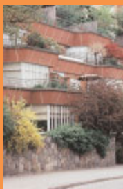
Galjonsbilden 22, Gröndalsvägen 50–56. Terrasshuset med små, välutnyttjade lägenheter och stora terrasser blev lösningen för den branta tomten.