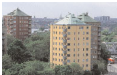
Danviksklippans karakteristiska silhuett med de toppiga punkthusen liknades vid blyertspennor i debatten som följde när husen var nyuppförda 1945. Foto Göran Fredriksson, 2001.