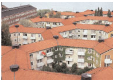
Akterspegeln 21, Sjöbjörnsvägen 16–52. De dekorativa vita omfattningarna gjordes för att förstärka ljusreflektionen in i lägenheterna.