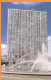
Stigbygeln 5 , Sergels torg 12. Femte höghuset är ett av Backström & Reinius mest synliga hus men inte särskilt typiskt för deras stil. Foto Göran Fredriksson, 2001.