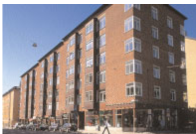
Tegelslagaren 12 , Nytorosgatan 36–58. Arkitektkontoret Backström & Reinius första projekt. Här inleddes också samarbetet med Olle Engkvist och förtjusningen i det röda teglet. Foto Göran Fredriksson, 2001.

Ceremonien 6 , Nockeby backe 8. Backström & Reinius avslutade sin verksamhet med att utforma vårdavdelningen till pensionärshemmet Nockebyhus 1981. Skärmbyggnaden mot Drottningholmsvägen har tunga böljande tegelväggar och innehåller bl. a. simhall. Foto Göran Fredriksson, 2001.