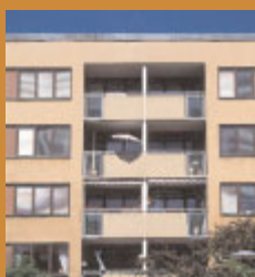
Alnmättet 1 , Tideliussgatan 11–43 på Södermalm byggt 1968. Brydes arkitektur under 1960- och 70-talen är ofta putsad i jordfärger som ger husen extra tyngd och massa. Volymerna är kraftiga med skarpskurna hörn.