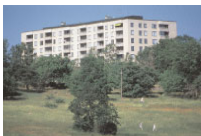
Kampementsbacken 3 , Kampementsgatan 32–38.