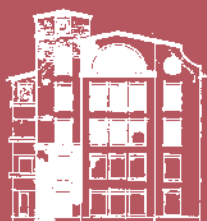
Autopiloten 2, Skarpnäck.