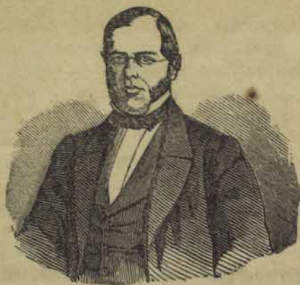
Jacob Adolf Wallenberg.