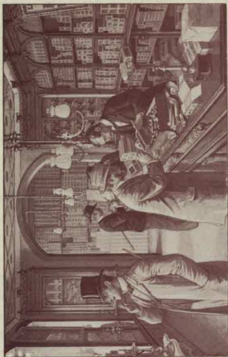
Interiör från Malmstorgsgatan 6.