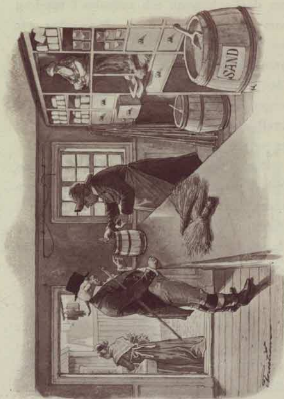
Tobakkebod från slutet af 1700-talet.