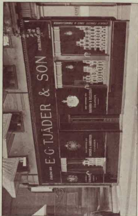
Filialen Riddarhustorget 18.