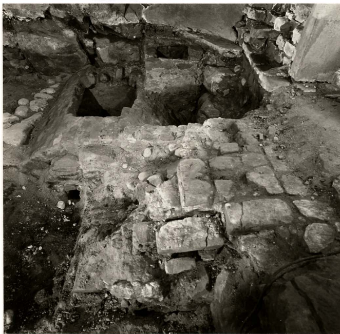
"Latrinvalvet" fr s 589-282:10