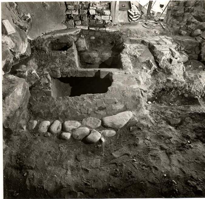
"Latrinvalvet" fr V 589-282:7