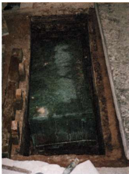
Gravöppningen i Varnhems klosterkyrka.

Men i Västra Götaland införde han ett eget myntsystem. 29 stycken mynt