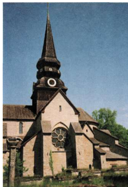
Varnhems klosterkyrka.

I många år var dock Birgers exakta gravplats okänd. 1920 restaurerades