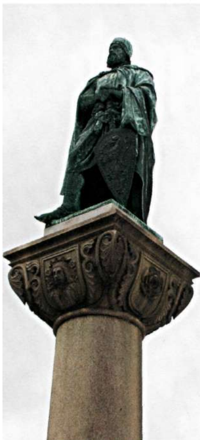
Birger jarls staty vid Birger jarls torg.

Enligt Erikskrönikan, Sveriges äldsta rimkrönika, daterad till 1320-talet, föddes Birger Magnusson på släktgodset Bjälbo i Östergötland. Han bör ha fötts under 1200-talets första decennium, före 1208 då hans far avled. Självdyker han upp i de svenska källorna på 1330-talet, som en av männen kring den unge kungen Erik Eriksson. Birger gifte sig med Ingeborg Eriksdotter, syster till den barnlöse kungen. Paret ska ha haft en kyrklig bröllopsceremoni, vilket var ovanligt vid denna tid. Med kyrkans erkännande fick Birger möjlighet att kräva rätt till tronen när kung Erik avlidit. De äkta makarna fick sex till namnet