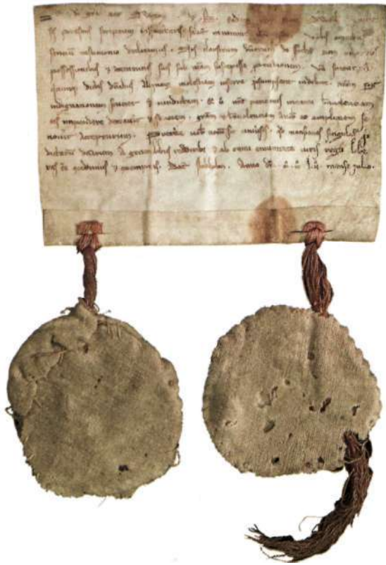
Det brev som ligger till grund för dateringen av Stockholm. Skyddsbrief för Fogdö kloster daterat i Stockholm juli 1252 av kung Valdemar och Birger jarl.

deln. Bygget kan dessutom ha irriterat tyska handelsmän, som inte längre hade fritt tillträde till Mälaren. Häri kan vi hitta förklaringen till att det stod tyskar på de äkta folkungarnas sida i slaget vid Herrevadsbro 1251. Vid ungefär samma tid slöt Birger ett handelstraktat med Lübeck som sade att tyska handelsmän som slog sig ner i Sverige slapp tull och skatt. I gengäld skulle de lyda under svensk lag och kallas för svenskar. Oenigheten mellan tyskarna och Birger jarl blev således inte särskilt långvarig.