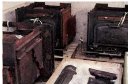
Bolindersspisen. Spisdelar.

Restaurangspisen har inventarienummer SSM 68141 och förvärvades 2002. 1Vid Bolinders tillverkades många olika produkter. Från 1845 tillverkades järnspisar. 1908 fanns 106 Bolinderska restaurangspisar uppsatta i Stockholm fördelade på 54 restauranger, 31 serveringar och matsalar samt 21 värdshus. 1909 startade produktionen av spisar i Kalhäll. 1930 var mer än 35 spispatent inregistrerade. Över 100 olika typer av spisar hade tillverkats. 400 000 spisar hade levererats från Bolinders verkstäder, till svenska kök men även till Danmark, Ryssland, Spetsbergen, Egypten, Finland, Österrike, Sydafrika och Tibet.