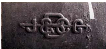
Bolindersspisens lucka.

Skötsel av spis, 1906: "Spisen afputsas utvändigt med blyerts, fuktad med öl eller dricka, och gnides med en hård borste så att ytan blir blank."