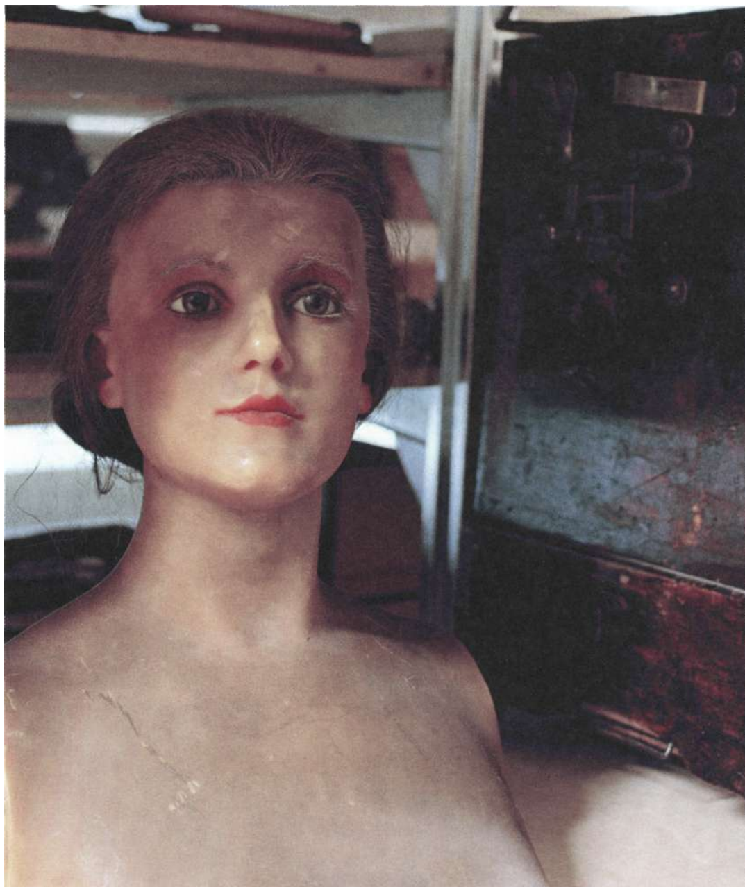
Skyldocka - sompuseet.

Sompuseet grundades av distriktsföreståndaren Björkebaum. Han började