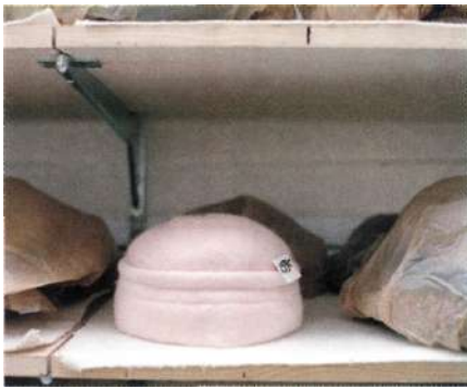
Skära hatten från Hattbaren.