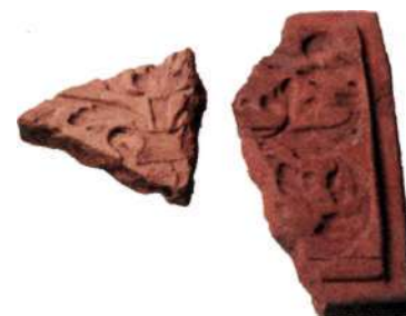
Matris och oglaserat kakel med växtdekor som tillverkats av krukmakaren i kvarteret Björnen.