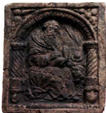
Evangelistkakel, som avbildar Markus med ett lejon.

Krukmakargränden, nuvarande Brunkebergsgatan, fick sitt namn efter en serie krukmakare som bodde där fram till 1790. Under 1700-talet förändrades kaklen och blev släta och i stället för reliefdekor kunde de bemålas. Invändigt förbättrades kakelugnens konstruktion så att de mer effektivt bevarade värmen. Under 1800-talets senare del tillverkades kakelugnar i nyrenässansstil och många av de gamla reliefkaklens formelement återuppstod.