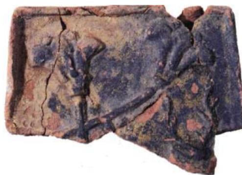
Ålderdomligt kakel hittat på Helgeandsholmen. Bladet är fastsatt på en avskuren halvcylander.

På Slottets inre borggård har man vid flera tillfällen hittat tidiga reliefkakel med motiv som S:t Olof, S:t Görän och draken, en hjort och ett älskande par. Relief dekoren är låg och ligger inramad av en smal kant. Glasyren är gulbrun. De dateras till 1400-talets andra hälft och är troligen importerade från Nordtyskland. Även vid den stora undersökningen 1978-80 på Helgeandsholmen påträffades liknande kakel.