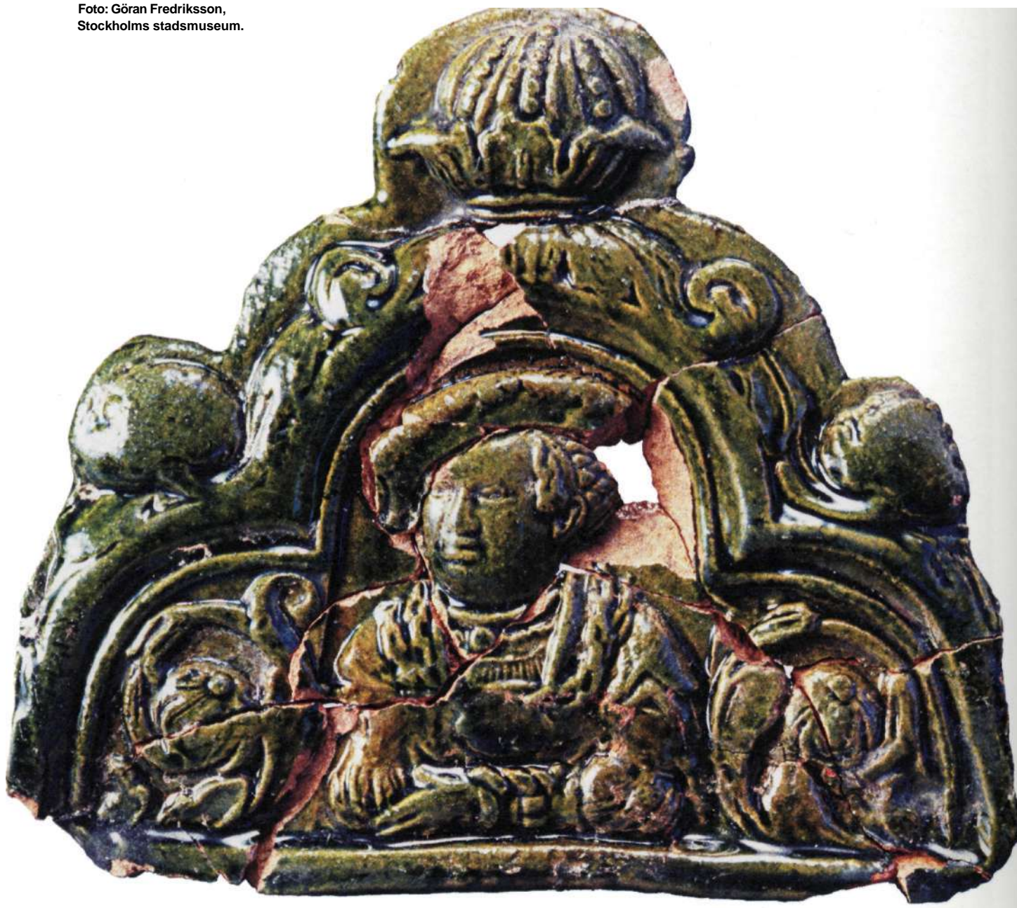
Krönkakel från kvarteret Svalan.

...text är väl tolkad. ...bär att du kan söka i ...kumentet. ...vffel och liknande som ...sämrrar sökningen ...ekommer. Texten ...ser är alltid likadan som ...oken den kommer från.