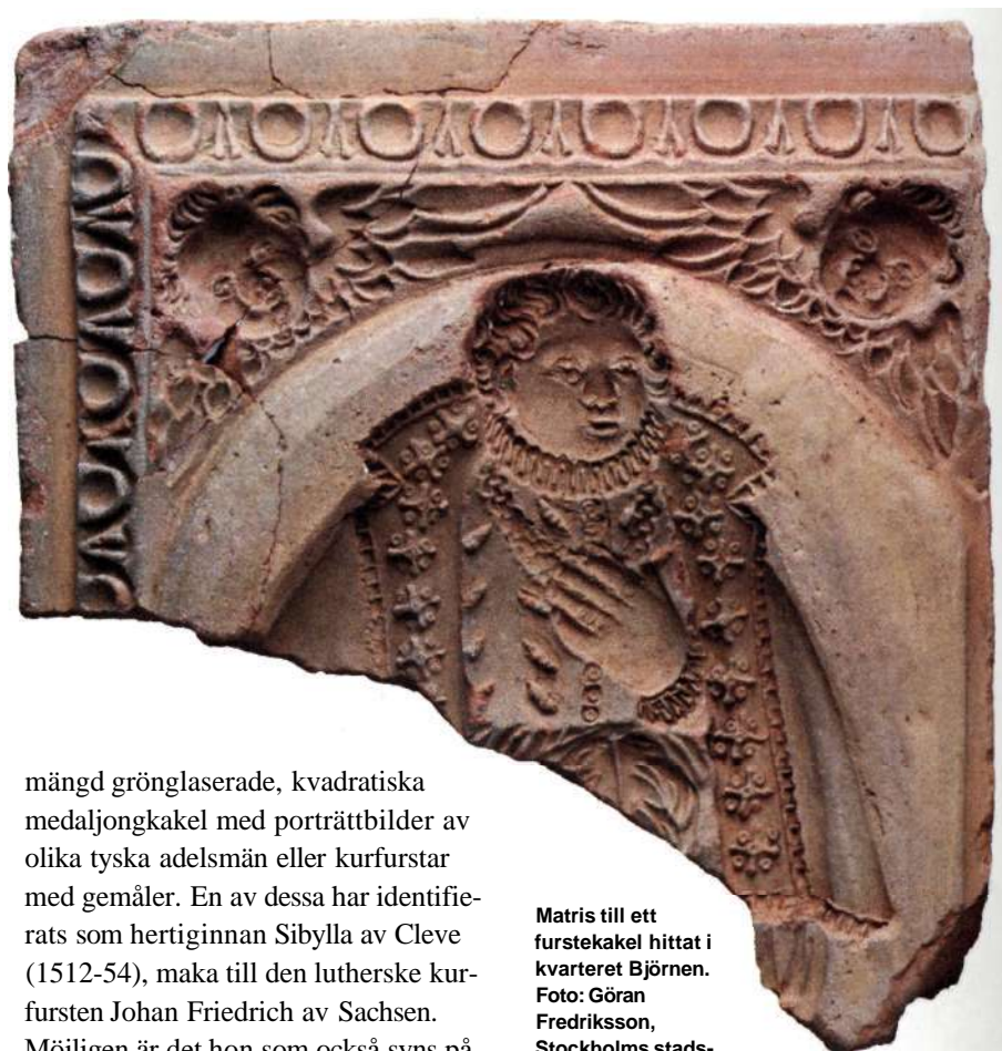
Matris till ett furstekakel hittat i kvarteret Björnen.

mängd grönglaserade, kvadratiska medaljongkakel med porträttbilder av olika tyska adelsmän eller kurfurstar med gemåler. En av dessa har identifierats som hertiginnan Sibylla av Cleve (1512-54), maka till den lutherske kurfursten Johan Friedrich av Sachsen. Möjligen är det hon som också syns på ett antal krönkakel, vilka säkert tillhört samma ugn (se titelbilden). Ytterligare fem porträtt i denna serie fanns bland fynden. En annan typ av porträttmedaljong föreställde Jesus i profil med långt hår och huvudet omgivet av tre strålknippen. En text runt honom lyder Ein vigvr ihesv christi . Flera av motiven på medaljongkaklen från kvarteret Svalan fanns också bland fynden från Kard-uansmakargatan.