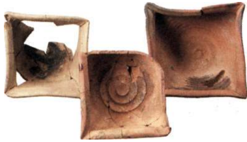
Tre pottkakel från kvarteret Svalan.