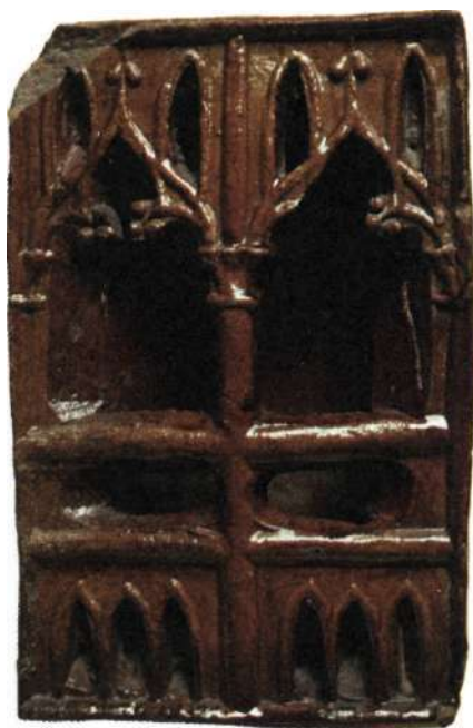
Gotiskt nischkakel från Prästgatan.

Nischkaklen var importvaror liksom de tidigaste reliefkaklen. Då frakten måste ha varit riskabel och tung, började reliefkaklen snart tillverkas här, förmodligen med en importerad matris, formen där reliefbladen pressades. Med tiden tillverkade man även matriserna här. Flera av krukmakarna, vilka var de som även tillverkade kakel, tycks ha invandrat från tyskt område. Man kan förmoda att de förde med sig både traditioner och kunskap från kakelugnens ursprungsområde.