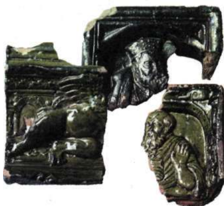
Kakel från krukmakarverkstaden i kvarteret Björnen.

krukmakare som förekom 1479 i Stadens Tänkebok, rådhusprotokoll, i ett vittnesmål om olovlig vedhuggning på stadens mark. Nästa gång någon