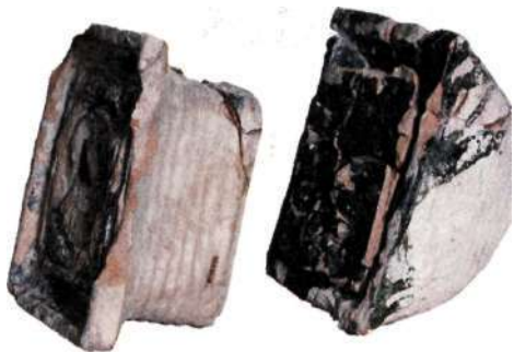
Två medaljongkakel vilka suttit som dekor på en husfasad från 1500-talet.

Ur pottkaklen utvecklades en annan kakeltyp. Genom att sätta ett blad med reliefdekor i krukans mynning och skära av dess botten skapades ett så kallat rumpkakel. Tillverkningen förenkla-