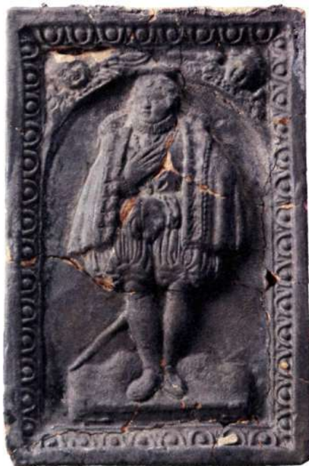
Svartglaserat furstekakel från kvarteret Svalan.

I kvarteret Svalan fanns inga krukmakare, men däremot tycks kakel från en hel ugn ha hamnat bland utfyllnadslagren någon gång vid 1500-talets slut. Vid en undersökning 1991 framkom en