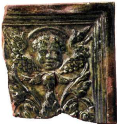
Glänsande grön kerub från 1500-talet, hittad i kvarteret Svalan.

De sista kaklen som tillverkades i kvarteret Björnen hade växtdekor. Både matris och ett oglaserat kakel påträffades där. Verkstaden fanns kvar i kvarteret till senast 1640. Då genomfördes en gatureglering vilken också medförde stora utfyllnadsarbeten. När nya gator drogs fram fick bebyggelsen anpassa sig. Men vi vet att krukmakare fanns i området långt in på 1700-talet.