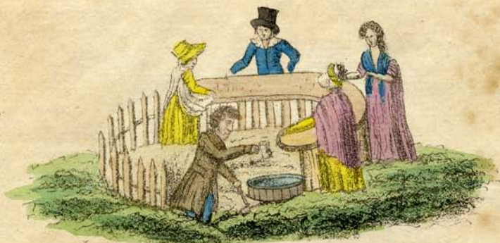
Den smikna! Brunnsmästaren!