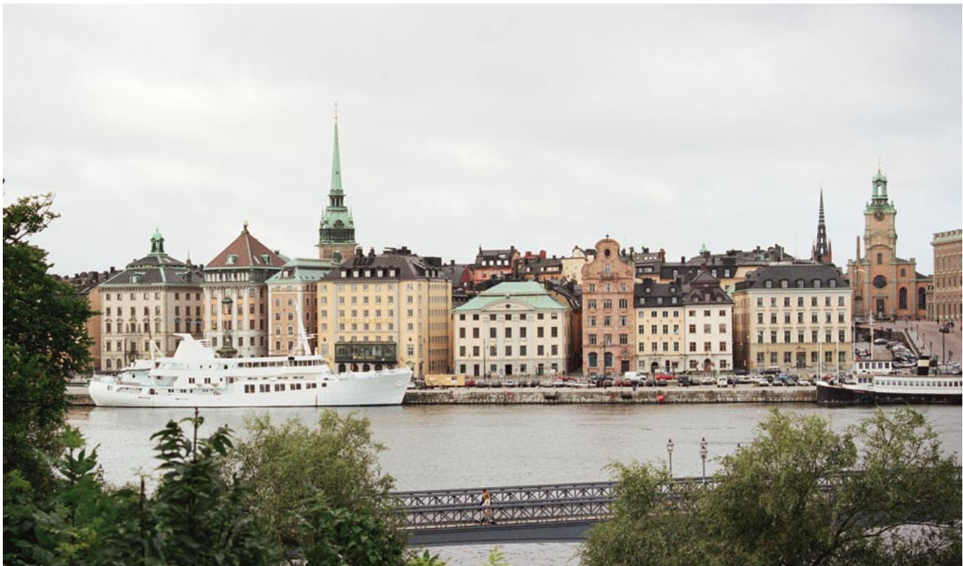
Skeppsbrons norra del sedd från Skeppsholmen.

ning lät AB Endrårkten som ny ägare göra en omfattande grundförstärkning. Vid äldre fasadrenoveringar hade alla gamla putslager avlägsnats och därmed prov på eventuellt sammanhängande äldre avfärgningar. Några putsrester som kunde bekräfta att Isaac Kocks hus ursprungligen haft fasadpartierna blågrått kimröksavfärgade, som en oljemålning från tidigt 1700-tal visar, påträffades inte. Olika ombyggnader har under olika sekler påverkat husets utformning, såväl i interiörer som exteriörer. Därför blev det vid senaste fasadrenoveringen de sengustavianska dragen i exteriörerna och framför allt i interiörerna som blev vägledande för den utvändiga färgsättningen sommaren 2000.