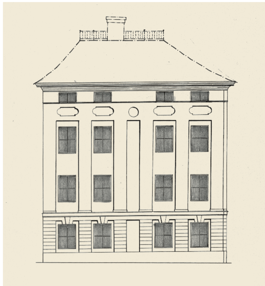
Cronströms hus omkring 1670. Den södra gränfasadens utseende rekonstruerat efter iakttagelser i samband med fasadrenoveringen sommaren 2000. Fönstren i huvudvåningarna sitter axiellt i grunda nischer och försänkta spegelfält ses i överst våningens fönsterbröstningar. Fönstren binds där samman av en profilerad sandstenslist. Bottenvåningens utformning är en fri rekonstruktion, liksom takfallet och altanen. Rekonstruktion av författaren.

skall man nog tänka sig trägolv i de flesta rummen medan förstugor, kök och salar kan ha haft stengolv. De sistnämnda var möjligen schackmönstrat lagda med omväxlande ljusa och mörka kalkstensplattor. De putsade väggarna var troligen vitmenade och i mer representativa rum kan ha funnits gyllenläder- eller stofftapeter. Gångse blyinfattade fönsterbågar var vanligtvis utåtgående, om de inte satt i stenkarmer. För att värma de flesta rummen fanns nog murade och vitmenade öppna spisar av olika slag, liksom kakelugnar av järn (sättugnar) eller keramik, medan salar