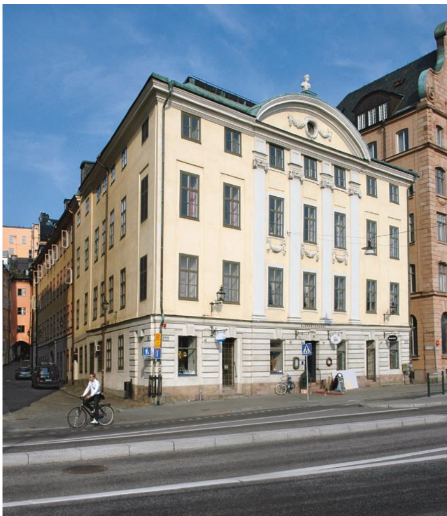
Skeppsbron 10 och Bredgränd, 2006.

Det var vid 1600-talets mitt som trovärdiga och relativt detaljerade avbildningar av staden började dyka upp. Erik Dahlbergs stockholms-teckningar från början av 1660-talet med staden sedd från öster domineras av Skeppsbroradens bebyggelse av gavelvända hus. De tycks vara präktigt byggda, många var försedda med branta tak bakom höga trappgavlar och olika typer av huggen stendekor. Allt pekar på tydliga nordeuropeiska influenser.