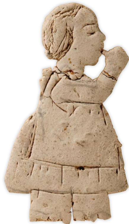
Anna Lindhagen som pepparkaksfigur. Ingår i Stadsmuseets samlingar.

och med ett litet leende i mungipan för hon bestämt tummen till sin mun. Hon bedöms vara fyra–fem år, och utstrålar envishet och kanske också ett humoristiskt sinnelag. Frågan uppkom varför Stadsmuseet har något så ovanligt som en pepparkaka i samlingen. Och varför är den vitaktig och luktar trolldag snarare än kryddor? Utseende och doft på ett bakverk förändras över tid och utebliven mikrobiell påverkan kan förklaras