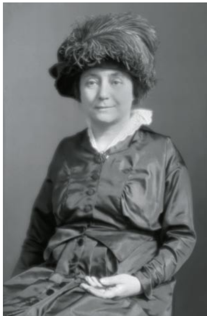
En något äldre Anna Lindhagen.

Anna Lindhagen gick bort efter en kort tids sjukdom 1941. En sak ångrade hon, och det var att hon inte tagit studentexamen och blivit advokat. Hon hade säkert blivit en utmärkt sådan, men tack och lov fann hon andra vägar att ta plats bland män i maktens korridorer och arbeta för det hon trodde på. Pepparkaksflickan med den bestämda minen är utan tvivel ett föremål värt att bevara till eftervärlden.