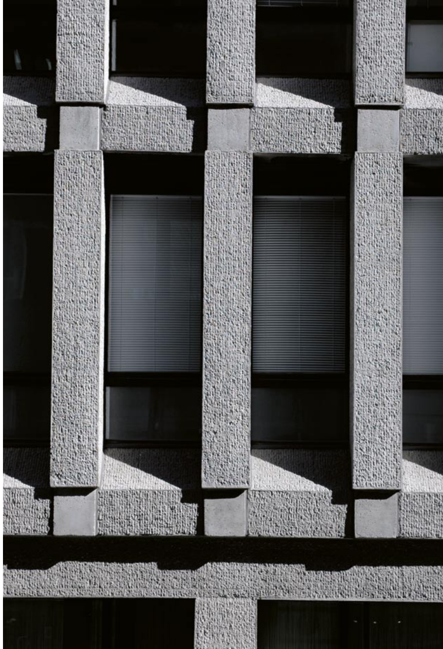
Betong användes som fasadmateriäl. Ibland obehandlad, men ofta mycket medvetet utformad. I Sverige- huset göts betongelementen mot en rutindelad form som sedan höggs med mejsel eller hammare så att skarpa brottytor framträdde. Arkitekten Sven Markelius experimenterade med gamla äggkartonger, gum- mimattor m.m., innan han hittade en gjutform som passade.

plåt blev ett populärt fasadmateriäl även om natursten med ytbehandlingar av olika slag var vanligast förekommande. Betong användes framförallt i stommar, men fungerade ibland även som fasadmateriäl i varierande uttrycksformer.