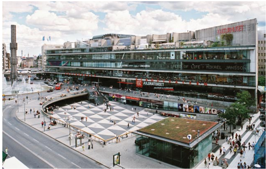
Kulturhuset, Riksbanken och Stadsteatern skapades utifrån en i detaljplanen tydligt uttalad önskan om en icke kommersiell motvikt till verksamheterna norr om Sergels torg. De tre stora byggnaderna utgör en sällsynt homogen och enhetligt gestaltad miljö invid torget.

Den omdaning av city som genomfördes i Stockholm under 1960- och 1970-talet låg i många hänseenden i