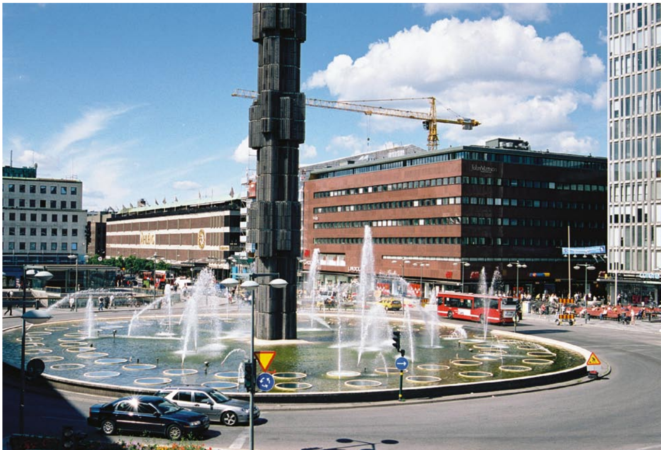
Klarabergsgatan med Åhléns och EPA-varuhuset väl synliga. Den breddade Klarabergsgatan blev det nya affärsstråk där man byggde varuhus i påkostade material med förebilder från Amerika.