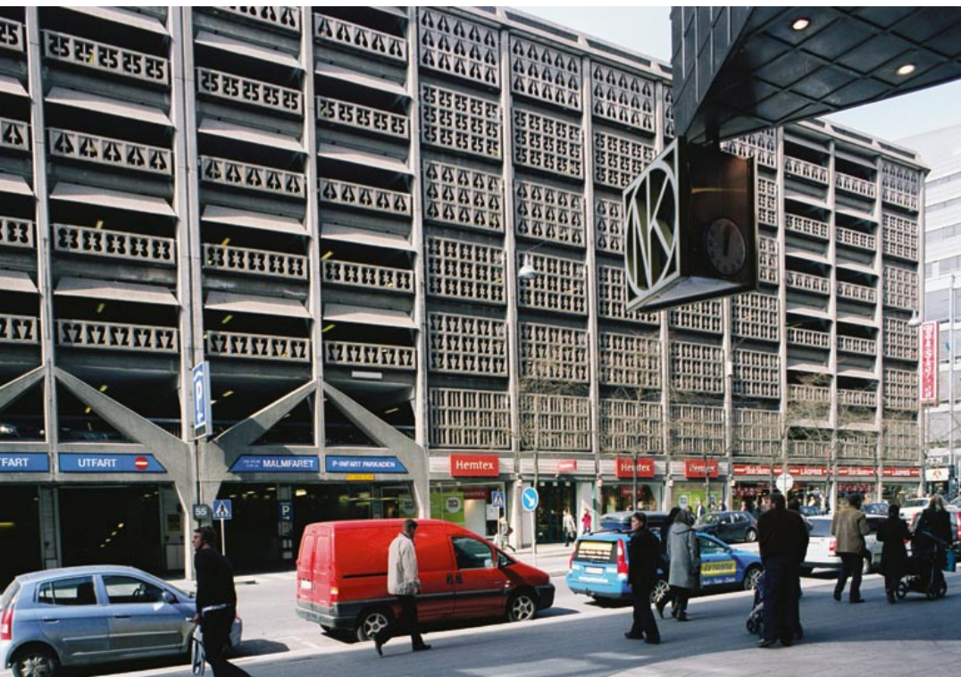
Parkaden är det enda i city kvarvarande exemplet på de många parkeringshus som byggdes under 1960-talet. Den står som en symbol för tidens starka tro på bilismen. Inför arbetet med att bygga Parkaden kallades amerikanska parkeringshusspecialister in för att skapa den mest yteffektiva och praktiska lösningen.

stadsplaneringens framkant, även sett utifrån ett internationellt perspektiv. Den genomgripande förvandlingen av city pekar, liksom den höga kvaliteten på arkitektur och materialval, på en stark vilja till förändring och en stor möjlighet att också genomföra den. Sverige var under denna period mycket framgångsrikt. Givetvis skulle detta manifesteras, i huvudstadens absoluta centrum skulle en stadskärna värd »världens modernaste land« skapas.