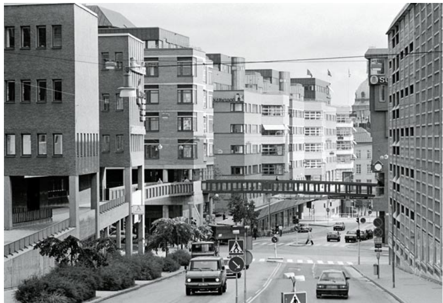
Oxen större är ett exempel på det tredimensionella Stockholm. Här fanns in- och utfarten till Klaratunneln, en av Stockholms viktigaste underjordiska genomfartsleder. Tanken var att bilisterna skulle använda gatuplanet i staden medan gångtrafikanterna rörde sig på broar, arkader, terrasser och gårdar inom kvarteret.

I city är husen uppförda i tidens anda. Arkitekterna tog till sig nyheter och använde sig av de senaste materialen. I Gallerian ritade arkitekten Sune Malmqvist, med inspiration från Tyskland, ett av de första husen i Sverige med fasader av glas. Eloxad