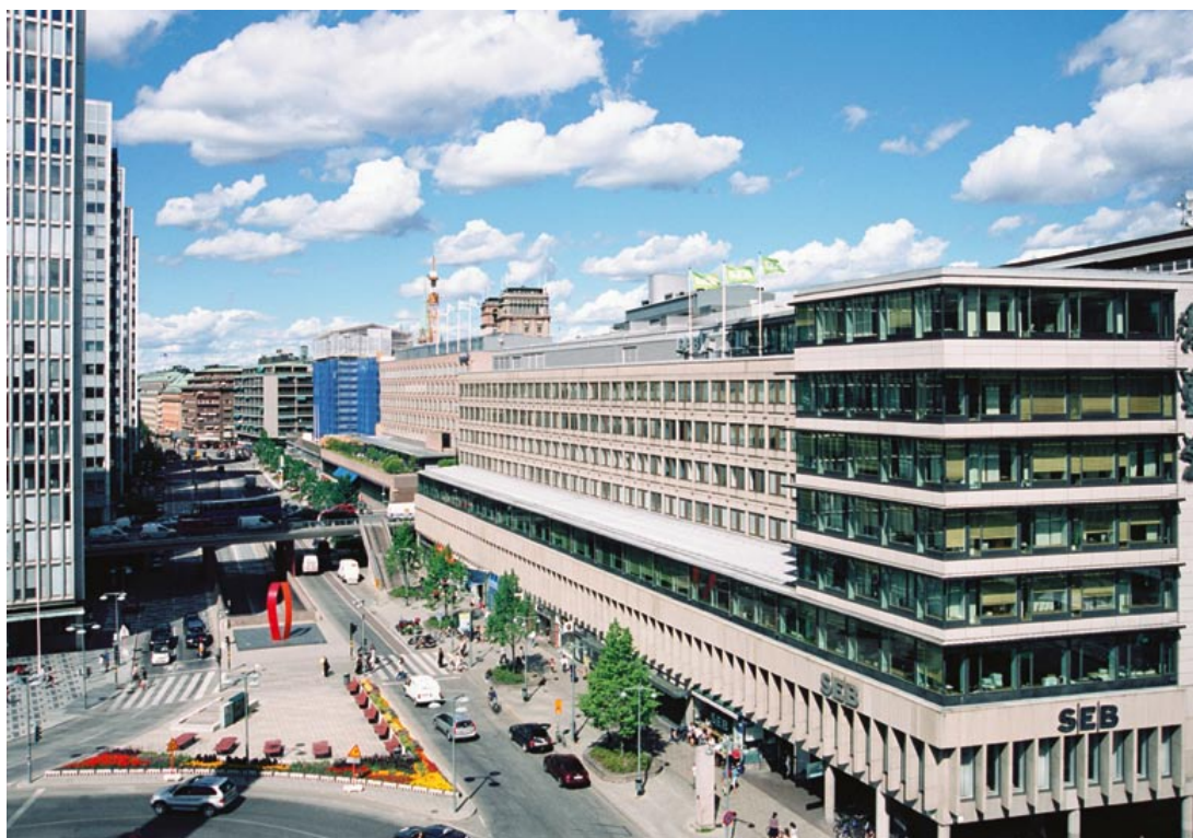
På platsen för den under århundradenas gång alltmer bortgrävda Stockholmsåsen byggdes hus som skulle markera dess sträckning genom staden. Stockholmsåsen är, och har alltid varit, ett viktigt motiv i Stockholms stadsbild.

Klassificeringen är ett instrument i den pågående planeringsdiskussionen. Vilka förändringar vill vi göra i Stockholm idag? Hur påverkar dessa förändringar möjligheten att avläsa Stockholms historia? Var finns de viktigaste och tydligaste exemplen från just den här perioden? För att förenkla planeringsprocessen arbetar man i Stockholm sedan länge med en klassificeringskarta. Den gör det lätt att se var det finns stora kulturhistoriska värden som man bör ta hänsyn till. Inventeringar och klassificeringar ger möjlighet att i diskussioner om framtida förändringar av Stockholm sätta in dessa i ett historiskt perspektiv.