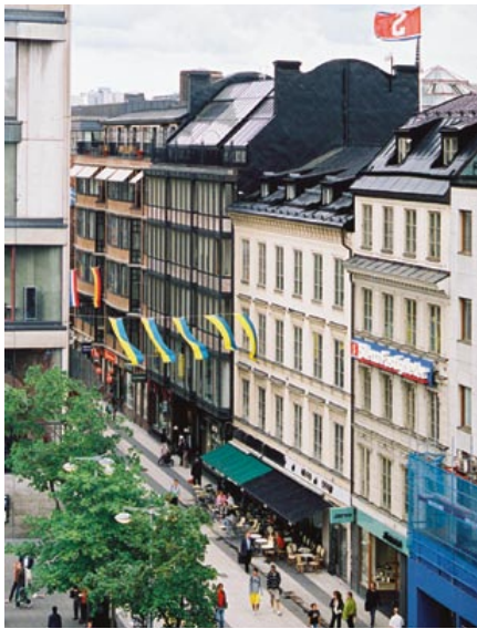
Under 1980-talet provades nya vägar inom stadsbyggnadskonsten. Här har fasaden delats in i fyra olika områden. Två är historiserande och efterliknar de 1800-talsbyggnader som en gång stod på platsen och en är ett original från 1912 som flyttats från Regeringsgatan. Hörndelen längst bort i bild är nyritad, men med tydliga referenser till jugendstilen i den närliggande fasaden från 1912.

Sverige ny typ av affärsstråk. I kvarteret Trollhättan (då Storviggen) byggdes Stockholms och Sveriges första inomhusgalleria. Ambitionerna var högt ställda. I detaljplaner och diskussioner förda mellan stadsplanerare och byggherrar framgår planerarnas vilja att Gallerian skulle bli en plats för stockholmarna att vistas och umgås i, dygnet runt, i en festlig omgivning. Man skulle också kunna handla, men det ansågs sekundärt. Gallerian invigdes 1976 och redan från början kritiserades den för att vara alltför kommersiell – tvärt emot planerarnas avsikt.