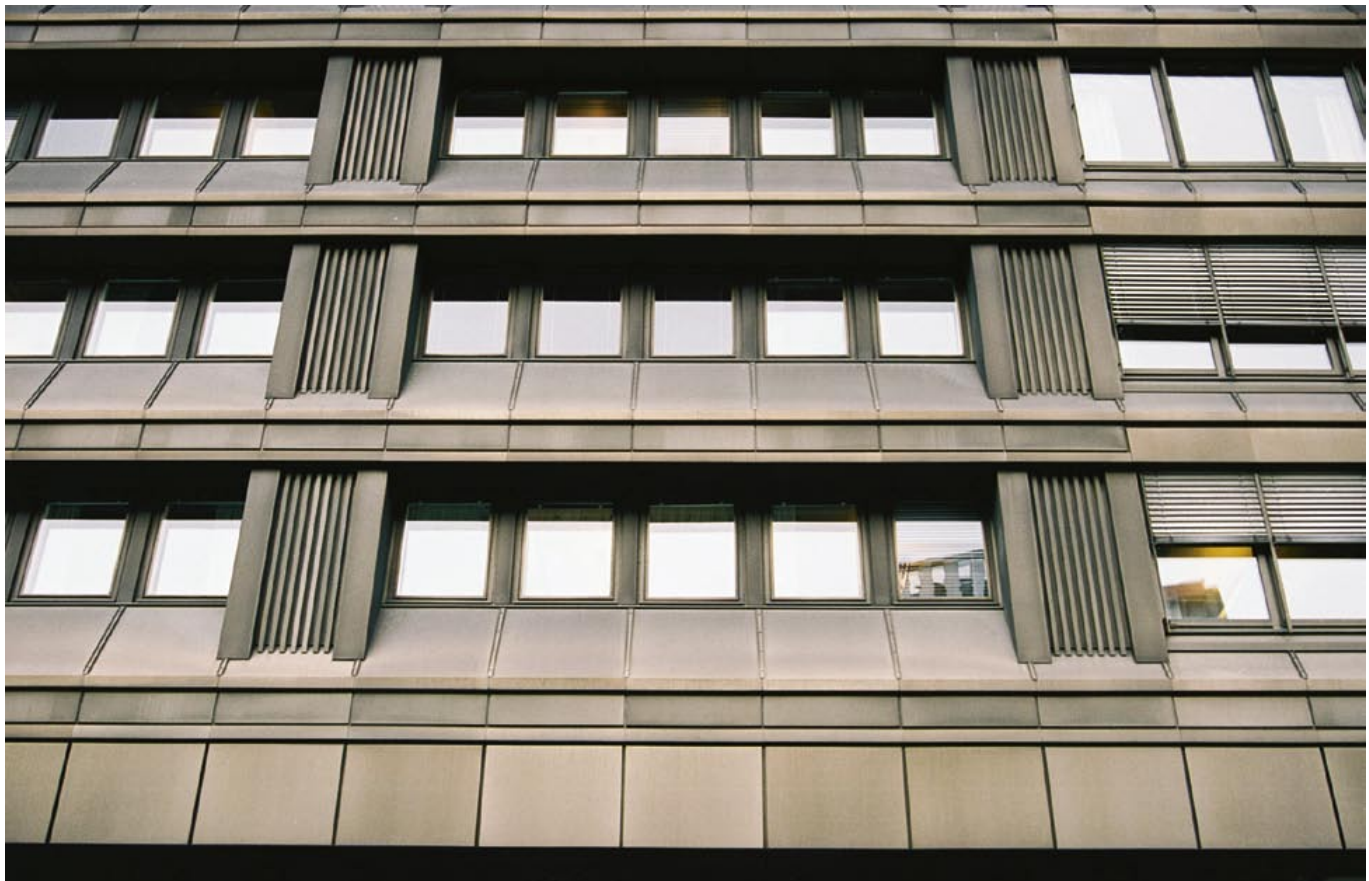
Plåt som fasadmaterial slog igenom på bred front under det sena 1960- och tidiga 1970-talet. I city finns en hel provkarta av olika typer av plåtfasader. Här ses kvarteret Trollhättan 33.

Fortfarande är city tämligen illa ansett. Nästan varje vecka kan vi läsa i dagstidningarna om idéer som ska förändra, förbättra och bygga bort det city vi har idag. Förändringarna syftar främst till att city ska få fler boende. Det finns en vilja att göra city trivsammare, mer »småputt-rikt« och med karaktär av bostadsområde. En annan trend som kan skönjas är att göra city blankare, stramare och mer elegant. Det gäller framförallt affärsstråken. I ivern att vara framstegsvänlig är det lätt att glömma att det nya Stockholm som skapades under 1960- och 70-talet nu också är historia – en mycket spännande sådan. Att riva och förändra city