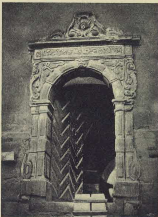
Tungelska husets gårdsport under rifningen 1874. Efter fotografi.

nalsgatan var hufvudprydnaden. 1 Hörnen voro rusticerade, mellan våningarna lopp en enkel list af sten, och öfver fönstren sutto turkhufvuden, hvarjämte den nedersta raden af denna om-