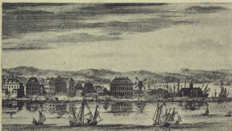
Blasieholmen, sedd från Heigeandsholmen vid 1600-talets slut.

Tomten förlänades 1650 20/7 till riksskattmästaren Seved Bååt och innehöll då 65 alnar i bredden och 120 i längden. 1 Sedan Bååt år 1669 aflidit, öfvergick tomten genom köpebref dateradt s. å.