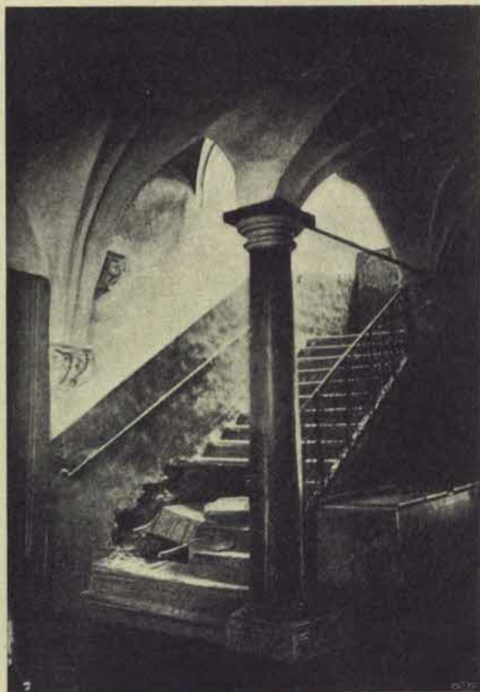
Förstuga i Tungelska huset under rifningen 1874.

ment i renässansstil. Möjligheten att få en eskiss af detsamma är numera mycket ringa, sedan bräderna delvis våldsamt lösslitits och användts för alla slags behof. Det hade emellertid varit af synnerlig vikt att få det noggrant aftecknadt, då det utgjorde kanske den enda kvarlevan af det i Sverige öfvade ornaments-