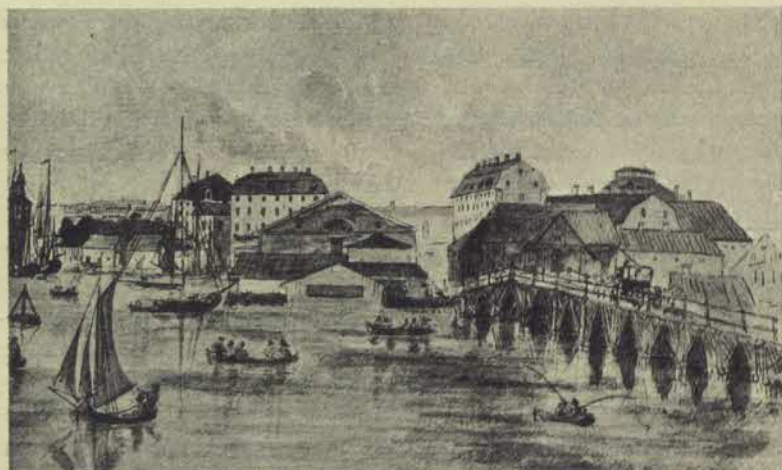
Blasieholmen och Skeppsholmsbron vid slutet af 1700-talet.