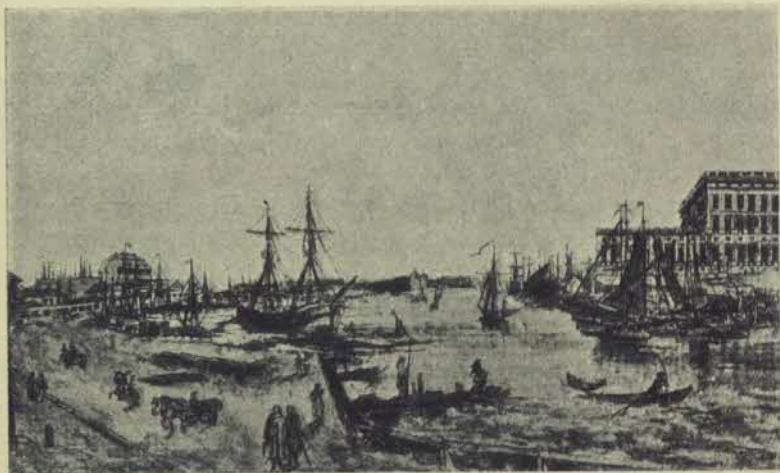
Södra Blasieholmshamnen från Operahuset vid slutet af 1700-talet. Efter gravyr af J. F. Martin i Vitterhetsakademien.

Redan 1841 gjorde Selenius dessutom en större nybyggnad, som förenades med det år 1826 uppförda huset, hvilket äfven samtidigt tillbyggdes. Friherre von Lantingshausen von Höp-