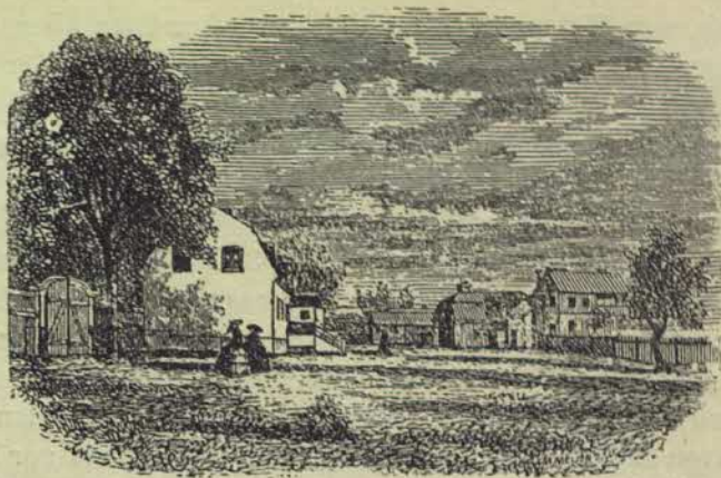
Vårdshuset Altona på 1850-talet. I senare tid »Tysta skolan».