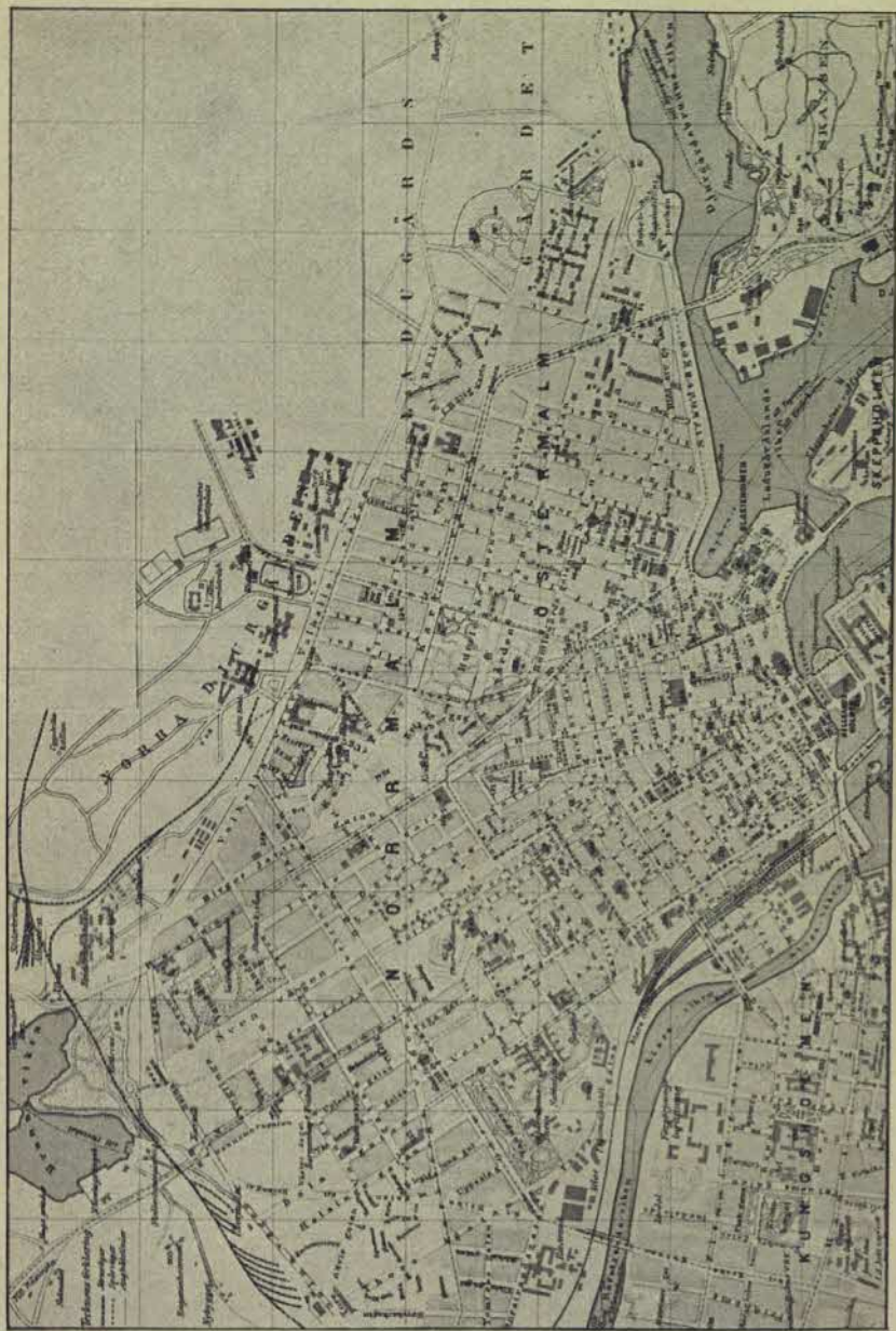
Plan över norra delen av nuvarande Stockholm.