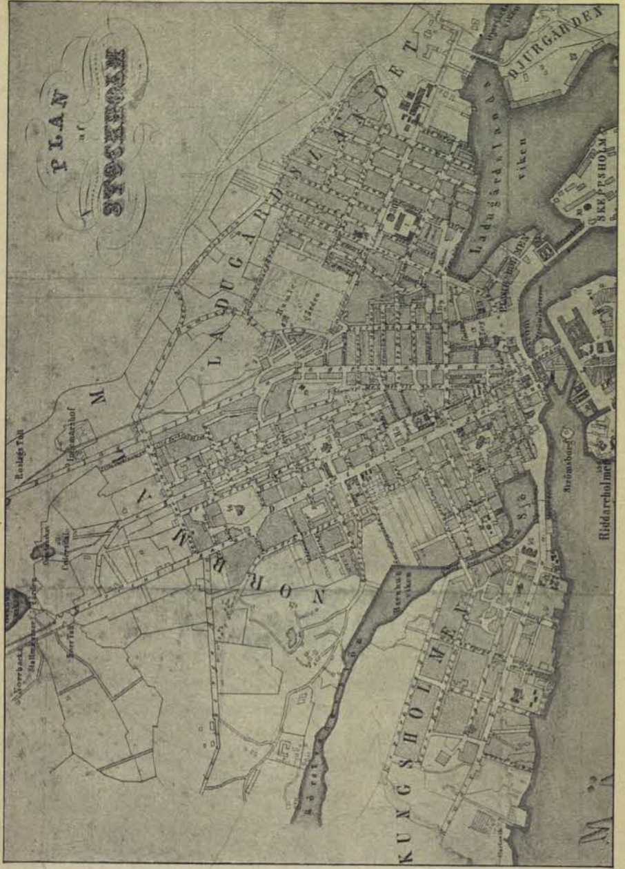
Plan öfver norra delen af Stockholm från år 1863.