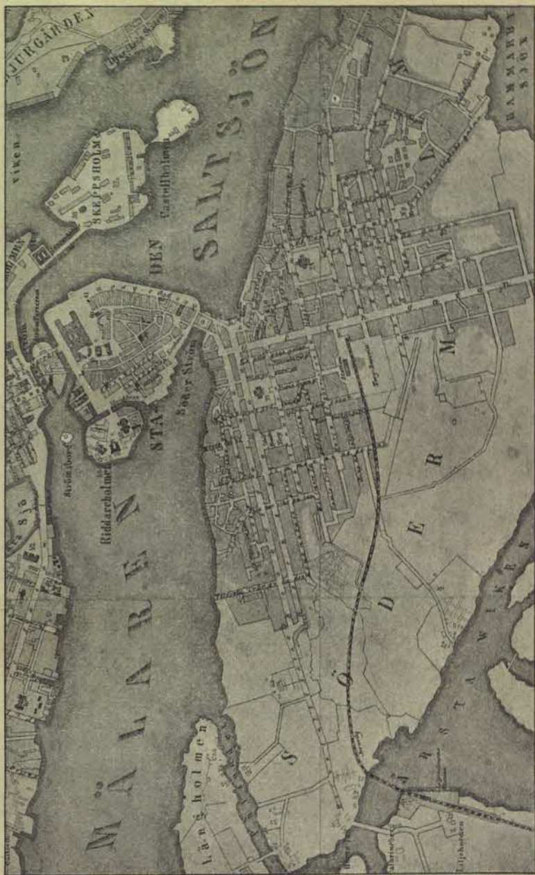
Plan över södra delen av Stockholm från år 1863.