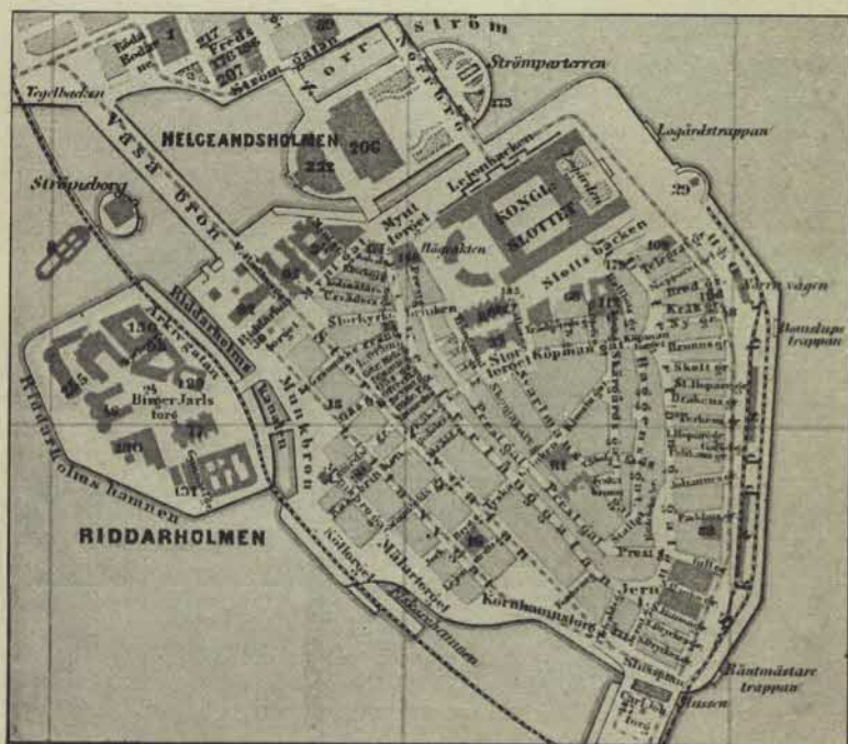
Plan öfver nuvarande Staden inom broarna jämte Helgeandsholmen och Riddarholmen.