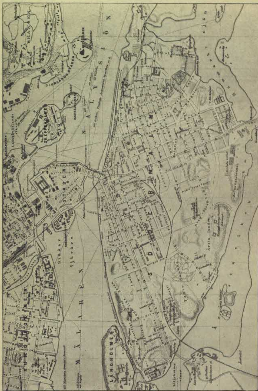
22. Palats och kåkar.

Plan över södra delen av nuvarande Stockholm.