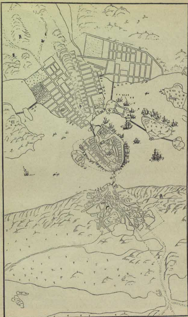
Karta öfver Stockholm på 1640-talet.