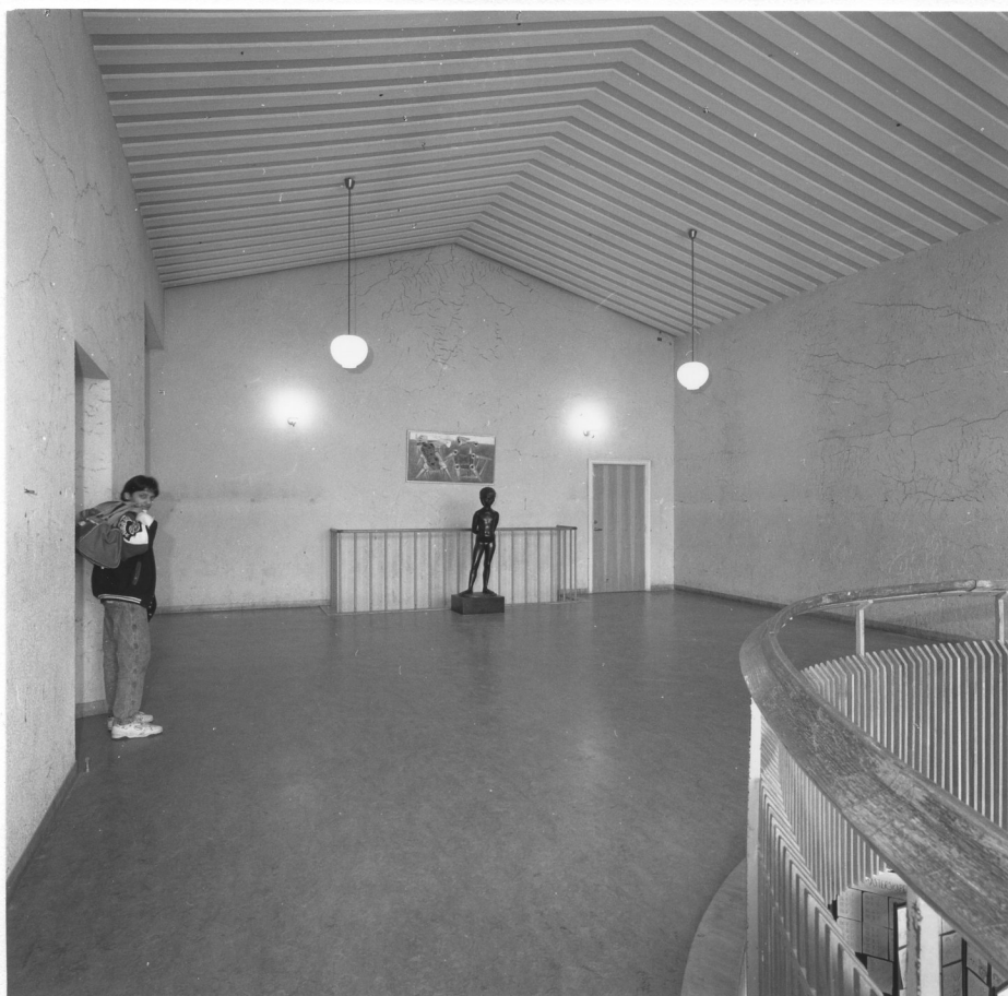
S92-0179-10 Övre etage i ljushallen.