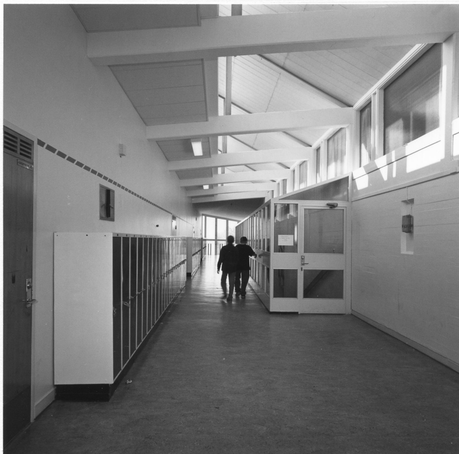
S92-0510-3 Korridor med inbyggda trappor.