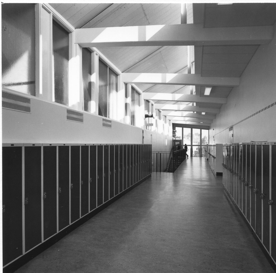
S92-0510-2 Korridor i ursprungligt skick.